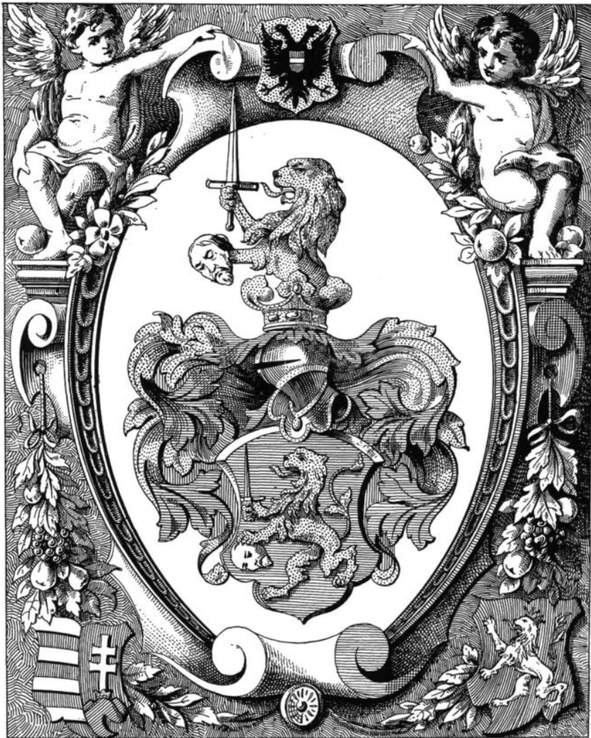
GYÖNGYÖSY-HORVÁTH CSALÁD CZÍMERE 1593-BÓL.