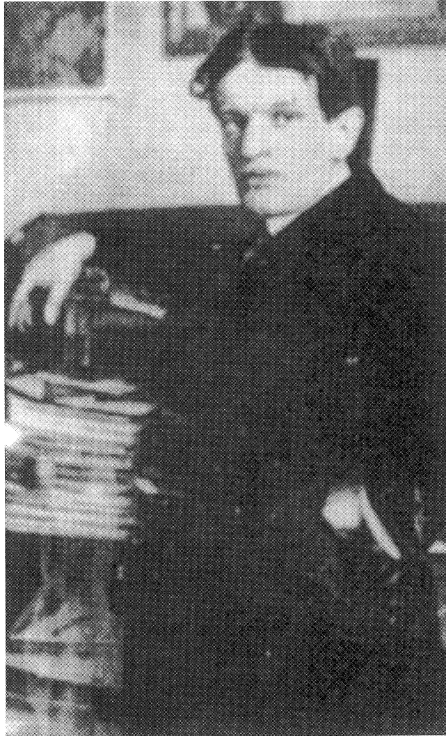
Karinthy Frigyes 1910 körül Szinházi Élet, 1938. szeptember 3.

„Megleltem a szót, azt a nagy talizmánt.”