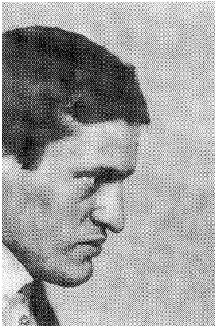
Karinthy Frigyes 1919 tavaszán Szinházi Élet 1919. március 16–22.

„... nem kiáltozok az uccán és nem ragasztok kokárdát és nem nyilatkozom se jobbra, se balra.”