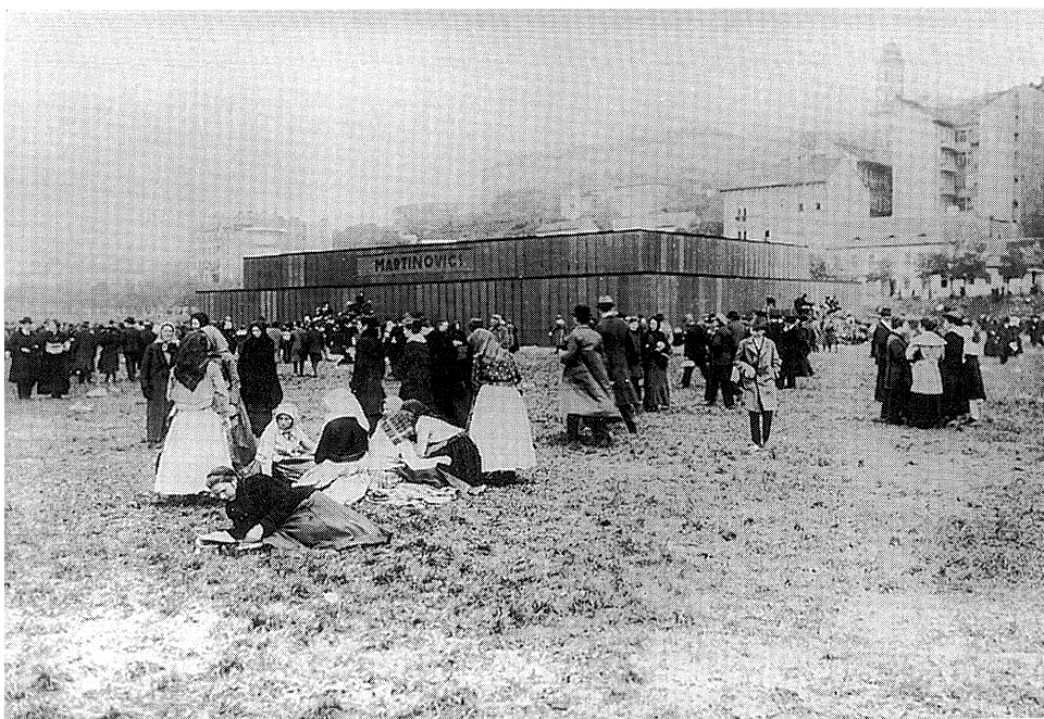
Vérmezői szarkofág, „Martinovics” felirattal 1919. május 1.

„... hatalmas méreteivel, komor és nemes stílusával a mult véráldozatáról beszélt.”