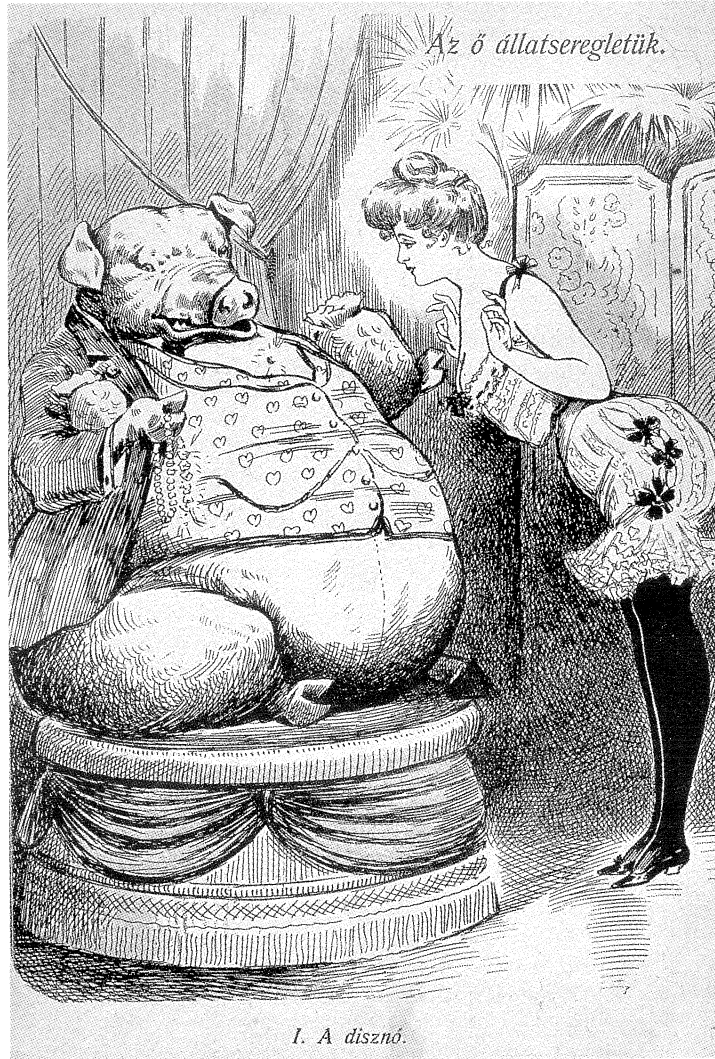
„Az ő állatseregletük. I. A disznó” Flirt, 1904. 4. sz.