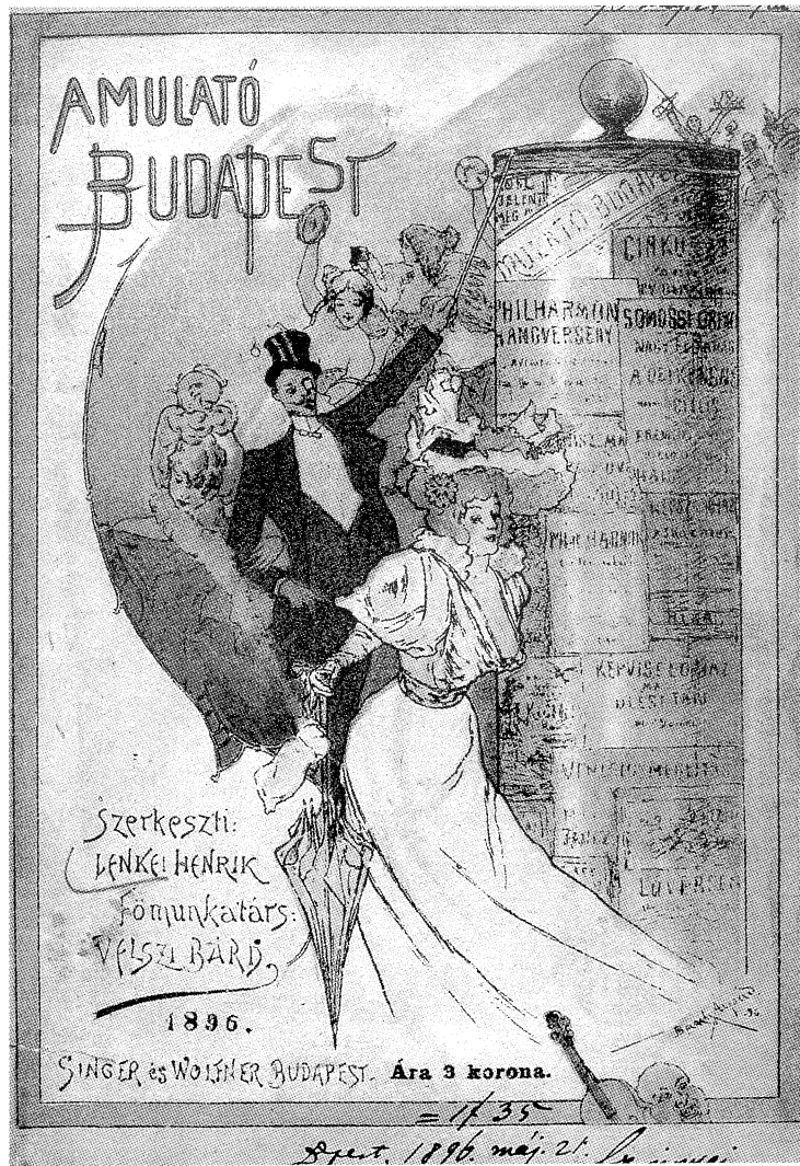
A mulató Budapest című alkalmi lap címlapja 1896. május 21.