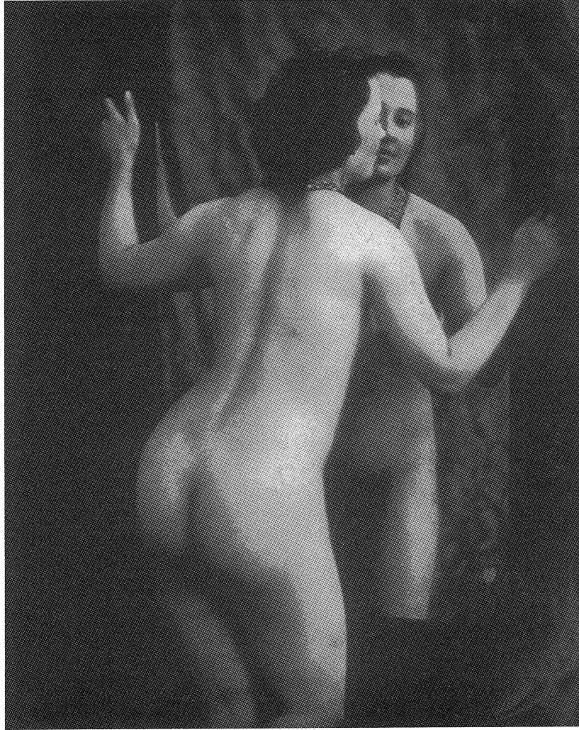
Műtermi aktfotó a századforduló idejéből