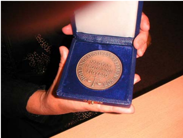
Magyar Irodalmi Figyelő emlékérem