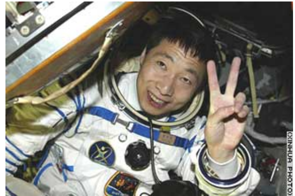
Figuur 2. Yang Liwei na landing.