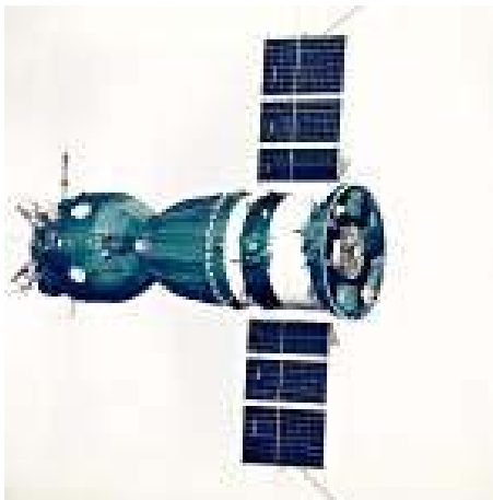
Figuur 5. Sojoez A.