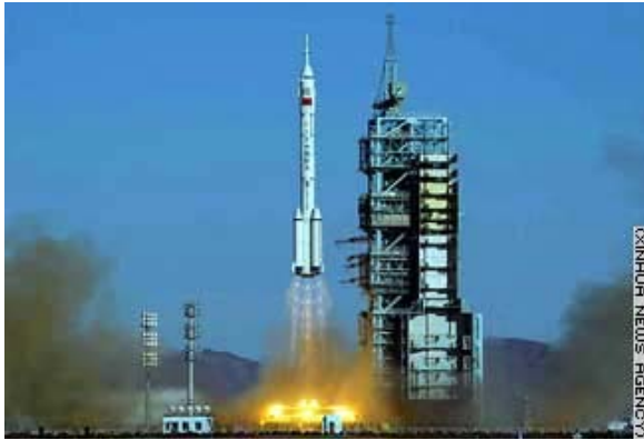
Figuur 1. Lancering van Shenzhou V.