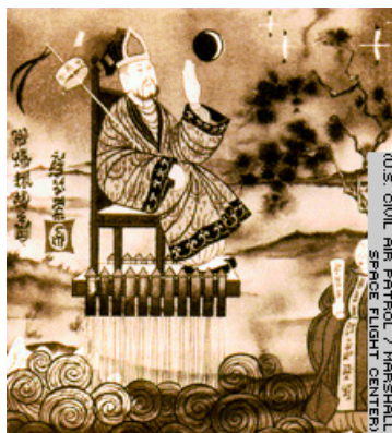
Figuur 3. Wan Hu onder weg naar de sterren....