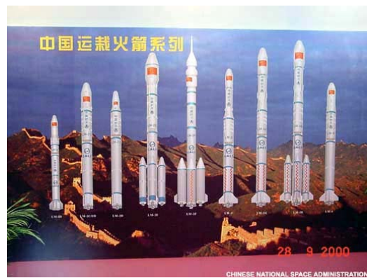
Figuur 4. Lange Mars raket-familie.