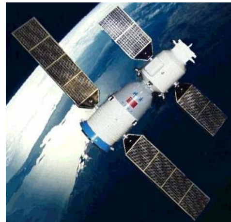
Figuur 6. Shenzhou.