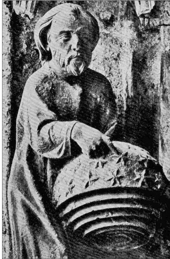
A csillagokat teremtő Isten alakja, Chartres, 13. sz.