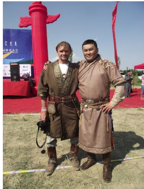
A mongol és magyar hagyományörző ruházat még őrzi a közös hun múlt divatját.