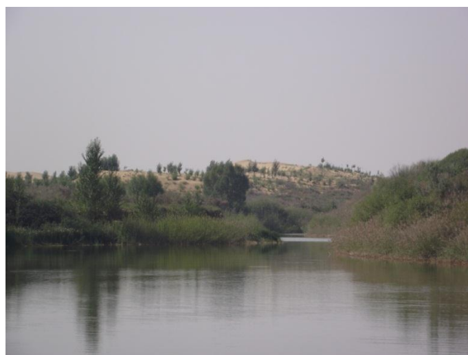
Engebei homokdűnéinél a hunok is megfordulhattak.