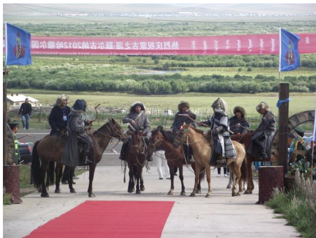
Mongol harcosok az ergüinei verseny megnyitóján.