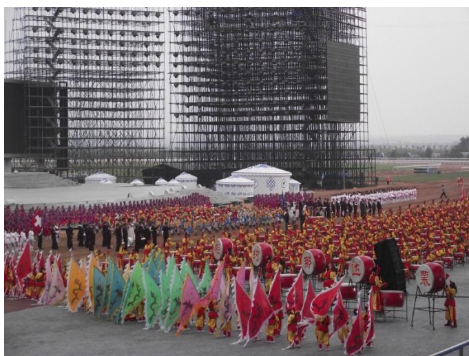
Az Ordosz Nádám nemzetközi sportverseny megnyitója.