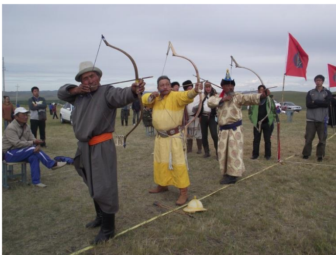
Életképek a nemzetközi íjászversenyből.