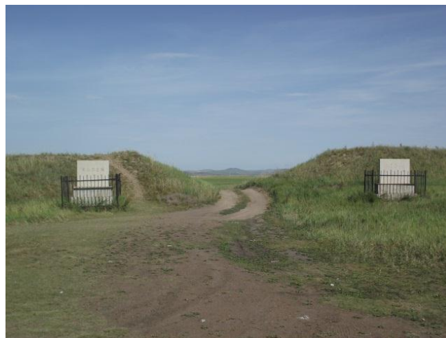
Kaszar városának bejárata.