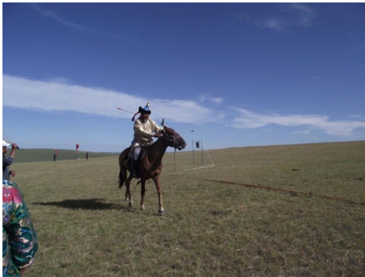
Mongol táltos is bizonyítja rátermettségét a lovas íjász versenyen.