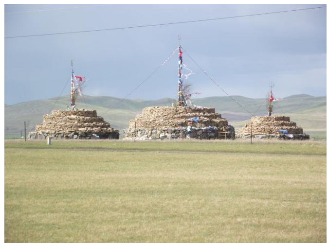
A nádam-obó Ergünébe. A verseny résztvevői ott áldoznak a helyi szellemeknek.