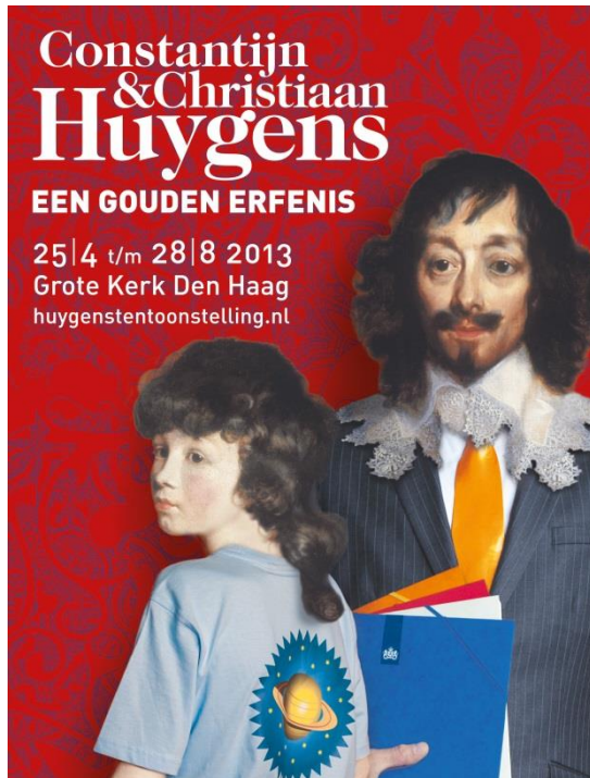
Huygens Tentoonstelling