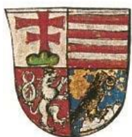
Mátyás címerének egyik részlete (1488)