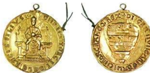
Imre király 1202-ben kiadott aranybullája

Ezen kívül régi okmányaink pecsétjei is piros-fehér-zöld színű selyemszálakból sodort zsinórokon függték, mint például Imre király 1202-ben kiadott aranybullája. Pont e zsinórok árulják el nemzeti színünk legalább 800 éves korát, hisz azok már egy meglévő trikolorót utánoztak, ha mindig egyforma színűre készültek. Nemzeti színünket szerintem nem csak 800 évvel, hanem pár évezreddel ezelőtt választottuk magunknak, a még csonkítatlan magyar hazánkban, ahol bizonyításaim szerint a jégkorszak és így az özönvíz óta, nemesített búzákat természetve egyhelyben élünk. A piros-fehér-zöld ősiségére ezúttal olyan érveket hozok fel, melyek a tudatunkba sulykolt véleményeket megrendítik és így csak a józan megfontolás lesz a bírám. Meggyőződhetünk arról, hogy az előmagyarok szivárványt utánzó zászlaja a történelem előtti időkre megy vissza.