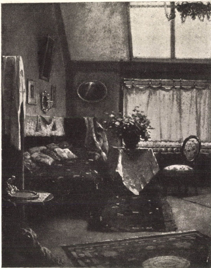
KOMÁROMI KACZ ENDRE