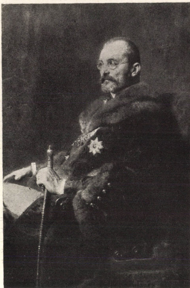
A Könyves Kálmán jogosításával