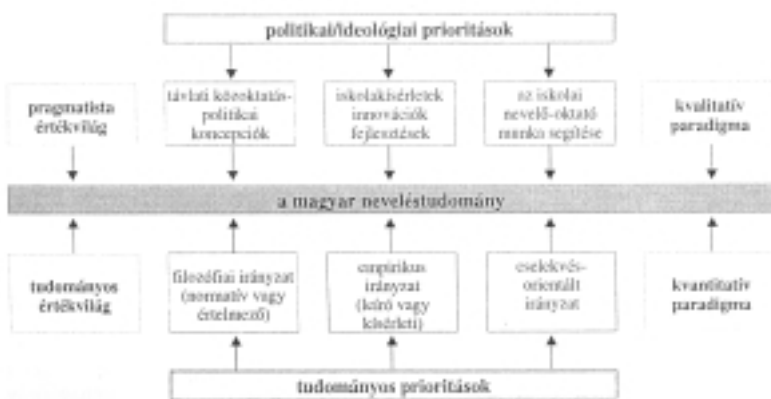
2. ábra. Politikai és tudományelméleti prioritások a hazai pedagógiai kutatásokban. (Báthory, 2000. 26.)

Az Educatio mellett az Iskolakultúra az, amely a rendszerváltásnak köszönheti létét. Profilját azonban egy másik Báthory-ábrával értelmezhetjük. (Báthory, 2000)