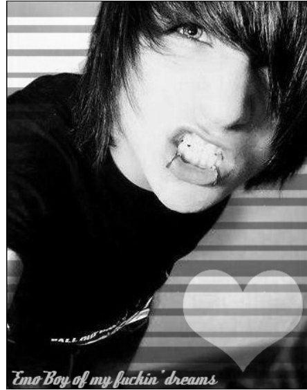
1. ábra. Emoboyok és emogörlök megjelenése 2. ábra. Egy emoboy – ajakpiercinggel