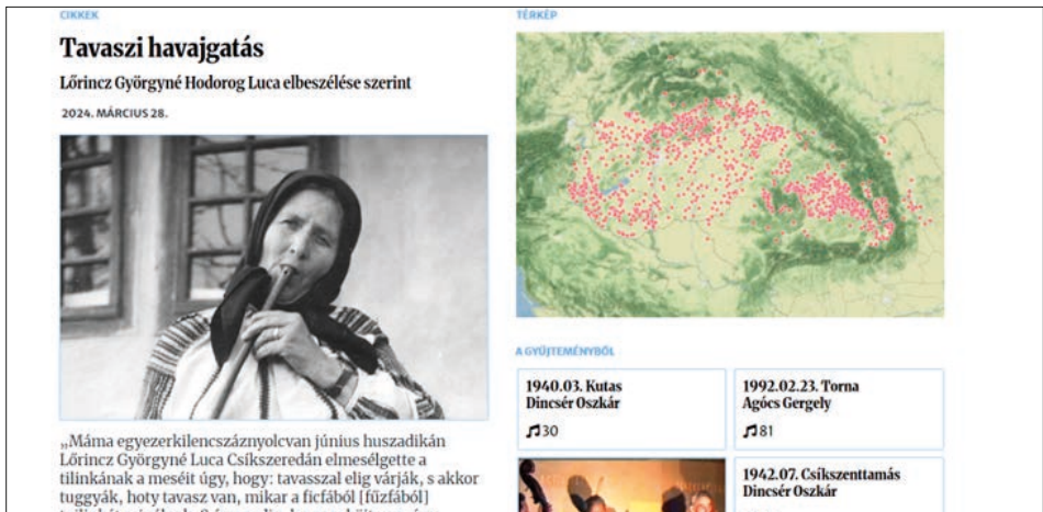
4. ábra. A Folklóradatbázis megújult felülete

A Folklóradatbázis 12 üzemeltetője a Hagyományok Háza, együttműködésben a Néprajzi Múzeummal és a MTA Zenetudományi Intézetével, így mindhárom intézmény gyűjtéseiből találhatóak tartalmak a felületen. Az oldal szegmensekben lejátszható népdalokat, tánczenét és táncos videót kínál, összesen 610 000 szegmensben, melyből 360 000 publikus. Jelenleg több mint 4800 órányi hangfelvétel áll rendelkezésre az érdeklődők számára (2024. 09. 26-i megtekintés). A gyűjtéseken készült hosszabb felvételek megállítása és részleteinek keresése helyett kiválaszthatjuk a nekünk megfelelő részt. A bevezetés utolsó szakaszába lépett a kibővített funkcionalitást és részletesebb keresést biztosító új front-end felület, amelynek béta verziója már elérhető a https://beta.folkloradatbázis.hu/ oldalon. Itt cikkek is megtalálhatók, melyek a szakma és a szélesebb közönség számára is érdekességgel szolgálnak. A térképen a kiválasztott helységgel kapcsolatos minden gyűjtést, illetve a lap szélén minden gyűjtőt és adatközlőt kilistáz a felület. A felvételeket listához adhatjuk, link segítségével megoszthatjuk és letölthetjük.