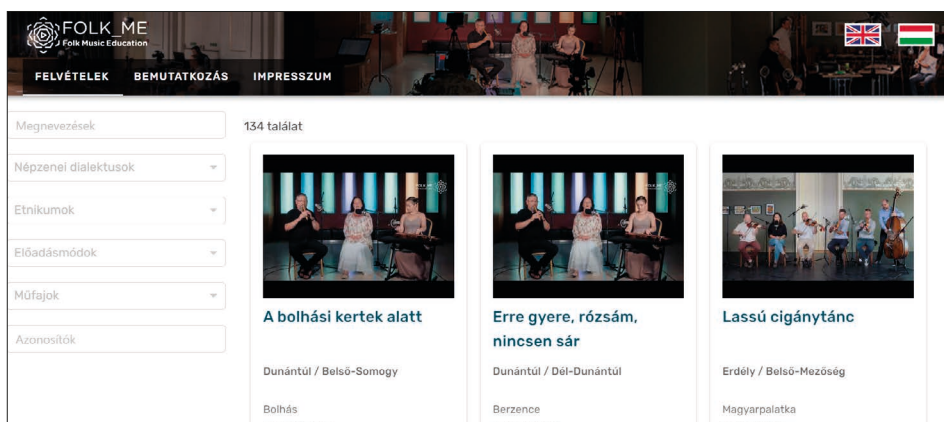
5. ábra. A Folk_me kezdőfelülete

A Folk_me 13 a legújabb adatbázis, mely autentikus népzenei tartalmat tartalmaz, de nem archív felvételeket, hanem stúdió körülmények között felvett videókat, melyeken ismert népzeneészek játszanak, énekelnek. A felvételek minden esetben több fő játszik együtt, énekes-hangszeres vagy több hangszeres felállásban. Ha a növendékek csak egy adott hangszeres vagy énekes szólamot szeretnének meghallgatni, úgy megtehetik a sávok vagy szólamok kiválasztásával. A szólamoknál külön meghallgathatók és nézhető az egyes szólamok, míg a sávoknál külön meghallgathatók a csokorban szereplő dalok, és az éppen nem szükséges hangszer vagy éneket elnémíthatjuk. Ezzel nemcsak az órán tanulhatnak, hanem otthon, egyedül is „játszhatnak zenekarban”, mely egy új lehetőség az oktatásban, kiterjesztve a tanóra keretein túlra is.