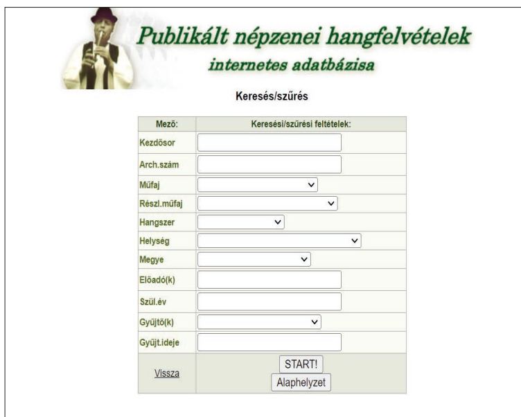
1. ábra. Publikált népzenei hangfelvételek internetes adatbázisa keresőfelülete

A Zenetudományi Intézet Hungaricana oldalán 10 népzenei gyűjtéseket tartalmazó fonográf-, gramfon- és magnetofon-felvételeket, kottás lejegyzéseket és Kodály Zoltán 1905–1958 közötti kéziratos gyűjteményét érhetjük el. A gyűjteményben kezdősor, település, gyűjtő és adatközlő szerint kereshetünk, amit szűkíthetünk évszám alapján.