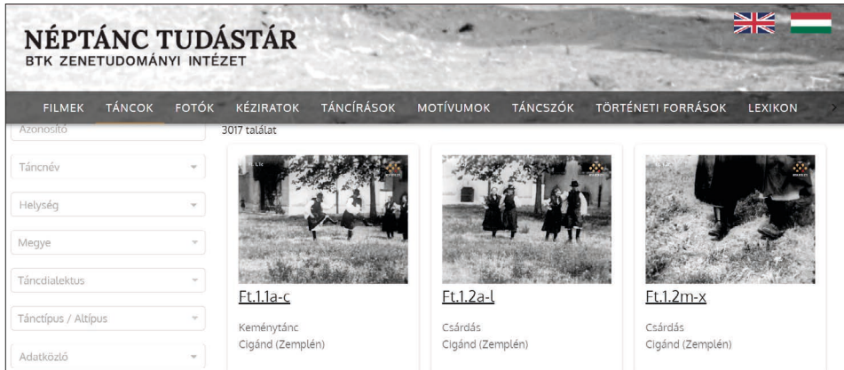
6. ábra. A Néptánc Tudástár kezdőfelülete

A népzene és a néptánc összekapcsolására használhatjuk az Erdélyi Hagományok Háza Alapítvány Zenei anyagok táncoktatáshoz oldalát. 15 Itt erdélyi zenekarok által feljátszott, tájegységek szerint válogatott felvételeket hallgathatunk, melyek nemcsak a táncosoknak hasznosak, hanem a tánc alá muzsikáló népzeneészeknek is.