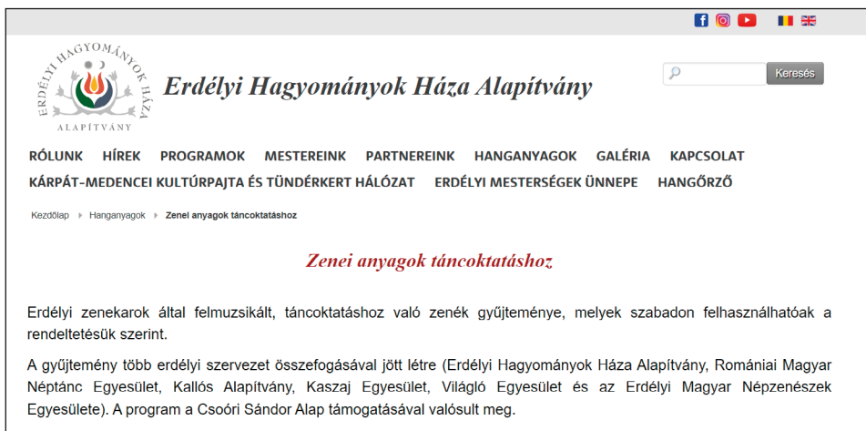
7. ábra. Az Erdélyi Hagományok Háza Alapítvány Zenei anyagok táncoktatáshoz oldalának kezdőfelülete

A népzene és a néptánc összekapcsolására használhatjuk az Erdélyi Hagományok Háza Alapítvány Zenei anyagok táncoktatáshoz oldalát. 15 Itt erdélyi zenekarok által feljátszott, tájegységek szerint válogatott felvételeket hallgathatunk, melyek nemcsak a táncosoknak hasznosak, hanem a tánc alá muzsikáló népzeneészeknek is.