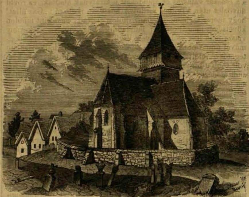
Keresztúri templom rajza.

madik kötetét veszszük. Mind a háromnak gazdag és változatos tartalma van. Lapokat töltenénk be, ha csak tartalomjegyzékét is közölnök. Hazánk sok nevezetes vidéke, városa, városa, történeti és természeti ritkasága rajzát találjuk fel bennök részletes