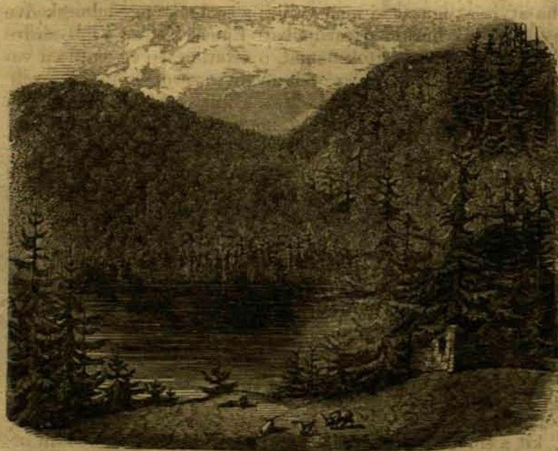
Szent Anna tava Erdélyben.

magyarozattal kísérve. Különösen Kecske-mét, Vác, Kolozsvár, Miskolcz, Diósgyőr, a radványi kastély, Máramaros és Nyitra vidéke, Munkács, Eszterháza, Erdőd vára bőven ismertetvék. A regényes Erdély tájképeiből e legérdekesebbeket veszszük. Hazai intézeteink közül a nemzeti muzeum, a magyar földtani társulat, az első magyar gőzfürdő Pesten, a váci siketnéma növelőintézet leírásai lapokat foglalnak el. Igen érdekes cikkek, mert szakértők tollából folynak: „A vacsi pusztá gazdasági tekintetben;“ „A timsó és kénkögyártása honunkban;“ „A fűvészet a magyaroknál.“ A történeti cikkek közül Budavár Mátyás király idejében; I. Mária királynő és Széchenyi Ferencz a nemzeti muzeum alapítójának életrajzai a nevezetesebbek. A hírneves magyarok képcsarnokában Csák Máté, Báthory István, Martinuzzi, Zrinyi Miklós, Wesselényi Ferencz és Széchy Mária, Zrinyi Ilona, Kazinczy Ferencz, Deák Ferencz, Vörösmarty, Markó Károly, Liszt, Megyeri arczkép- és életrajzait találjuk. Ezenkívül egy csoport természeti, történeti régiség és ritkaságot, tájszokást, népviseletet, népdalt hangjegyekkel kísérve, költeményeket Petőfi és Tompától képekkel díszítve, nyujt mindenik kötet. A pontosan kivitt rajzok száma több kétszáznál, a legtöbb természet után készült.