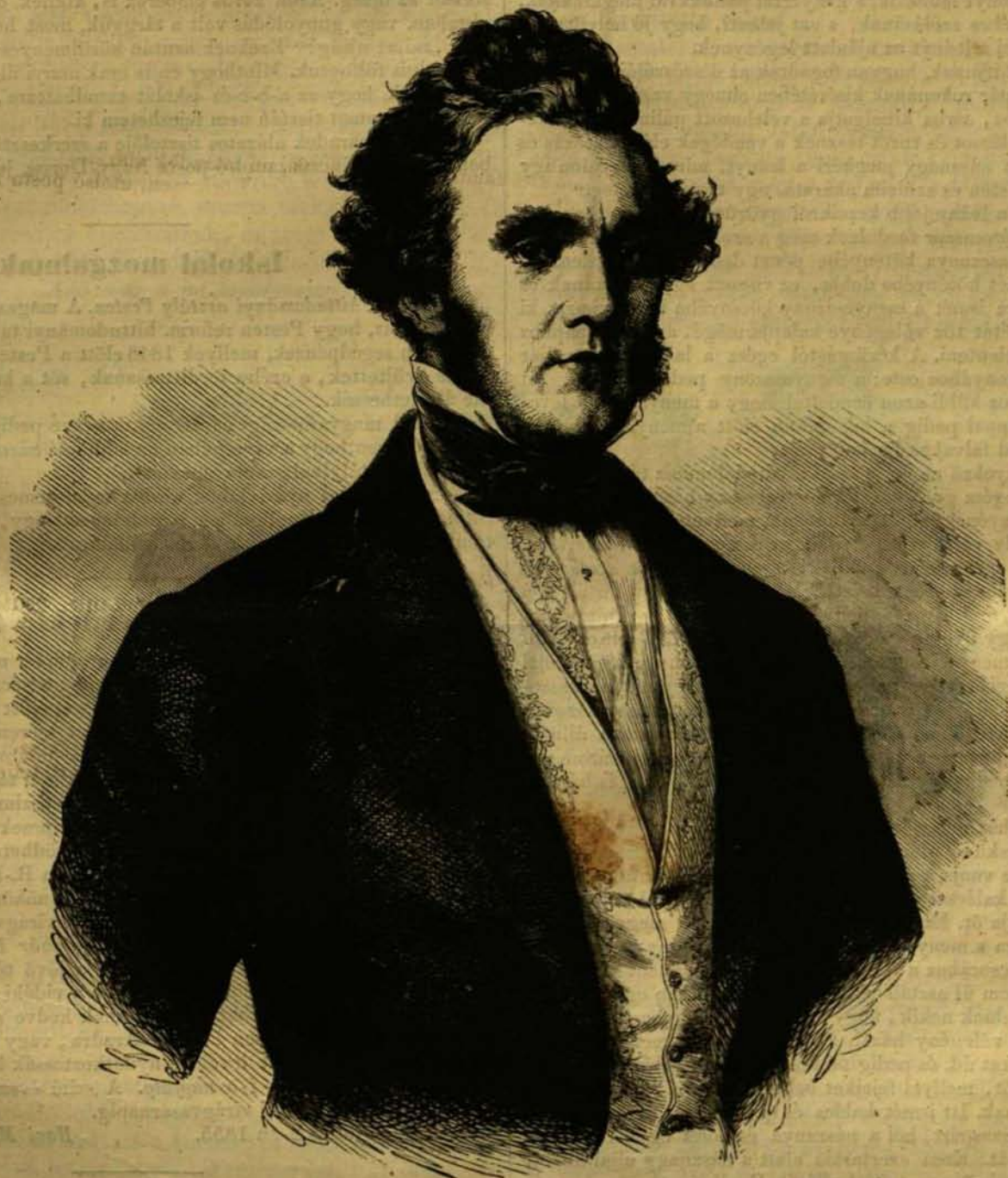
Layard Ágoston Henrik alsóházi tag az angol parlamentben. (Terjedelmes ismertetését lásd a „Pol. Ujd.” 21. 22-dik számaiban.)