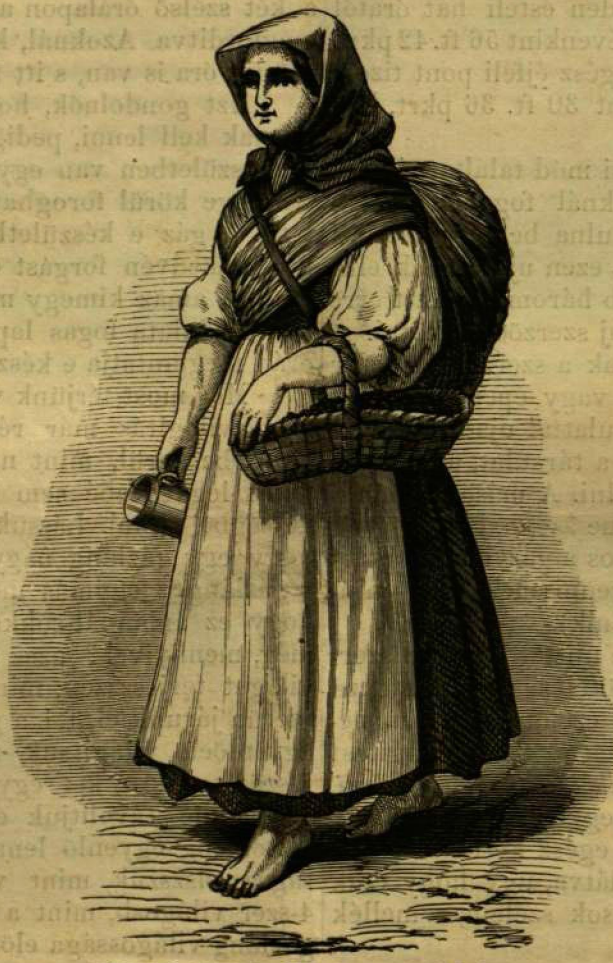
Népviseletek : IV. A számóczás leány.