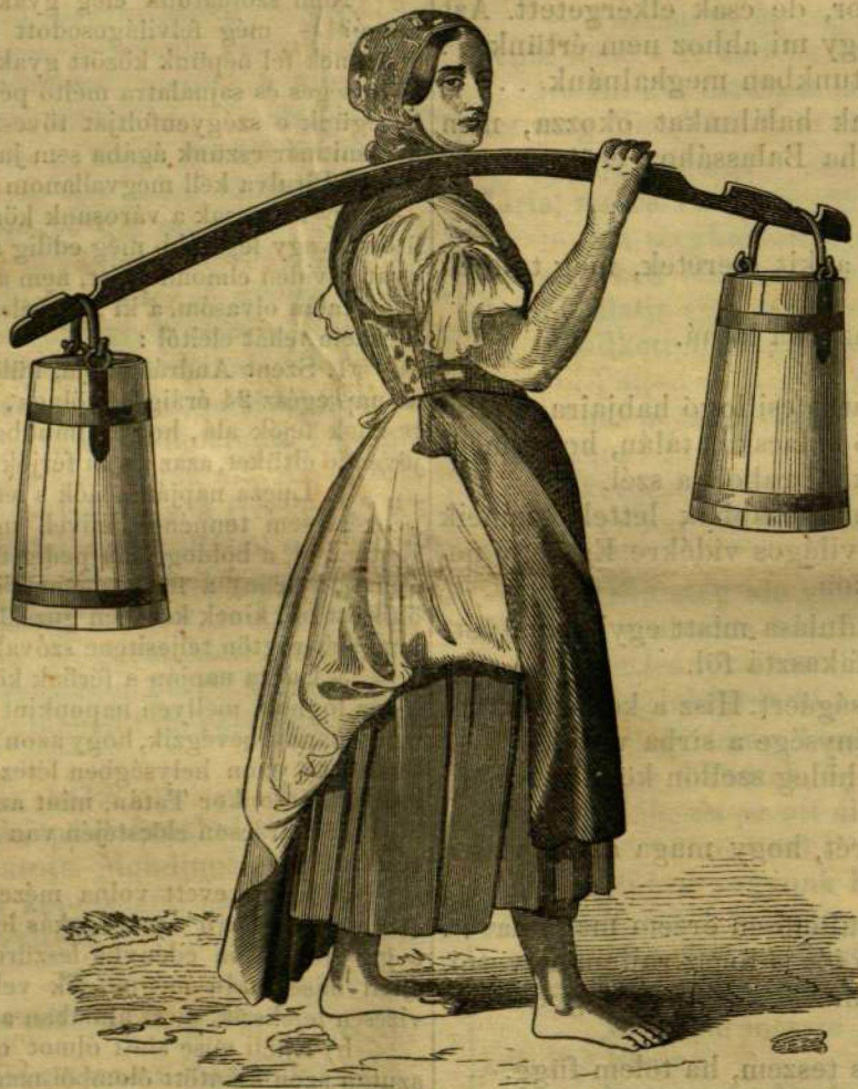
Szent-Tamási magyar menyecske.