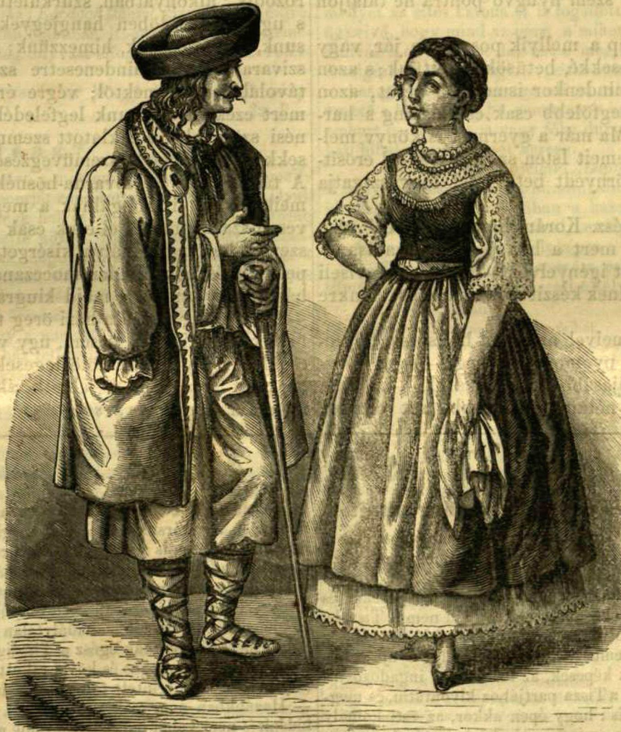
Rác férfi és rác leány.

Ha orvos volnék, messze kezdeném s terjedelmesen végezném, jól megphilippikázva, elősorolását mindazon erkölcsi s anyagi kihágásoknak, mik a szemeket gyöngítik. De orvos nem levén, óvakodom darázs-fészekbe nyulni. Azonban mégis kötelezettnek érzem magamat, tenni egy pár észrevételt, mik egy, szintén jó formán lejárt szeműnek, meglehetősen módjában állnak: annyival is inkább, hogy nem titkolhatom el abbéli aggodalmamat, miszerint most, midőn némelly természeti tanárok, eddigi érzékeinket, még egygyel, kettővel megtöldani is készek, még az eddigi öt érzékből is, egy veszendőbe menni készül. És ezen egy, az áldott látás , kétségen kívül, legbecsesb gyöngyszeme érzékeinknek. Ha hallásunk szenvedni kezd, körzetünk szives, nagyobbat kurjantni fülünkbe, s gyak-