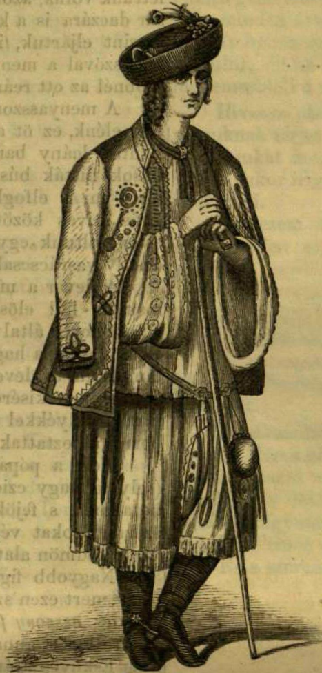
Nép- és tájrajzok : Sokáciz ifju.

Az ifju halála után özvegyi jognál fogva Beatrixra, Mátyás özvegyére maradt a zólyomi vár. Erről ismét a Frangepánokra szállt, azonban 1520-ban már ismét azon jószágok közt említettik, mellyeket II. Lajos nejének, ausztriai Máriának engedett, ki Thuri Kristófra bizta annak igazgatását. A mohácsi vész után elhagyván az özvegy királyné az országot, pártok és polgárháboruk szaggatván el a fegyelem minden kötelekeit s az igazságot önkény váltván fel,