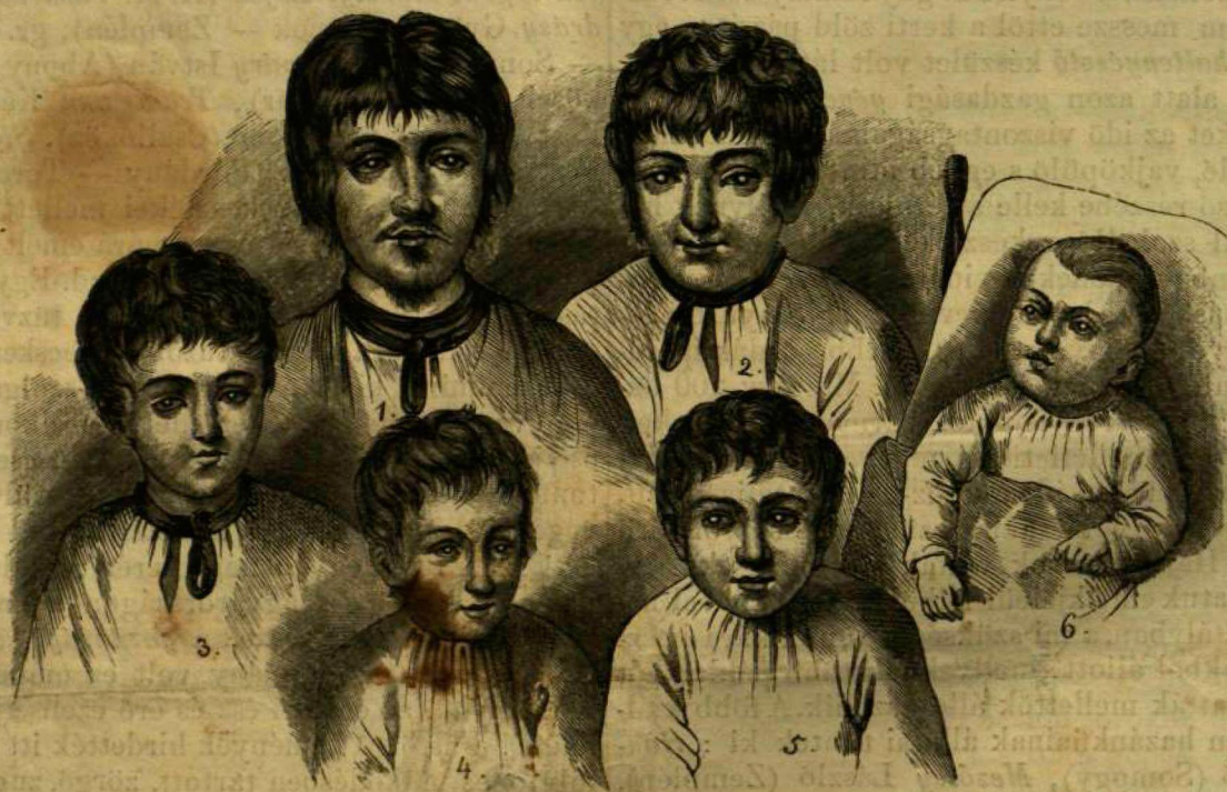
Vakon született 6 testvér Békés megyében.

ritva; a bozótos mo- csárt, mellyben a világ- kerülő bölény vissza- vonulva él, csak éjsza- ka lappangva ki a tá- voli vetésekre; a sziv- dobogató kalandokat a nőstény medvével, mellynek bőrét palás- tul viselte vállán az ifju, s a dühös vadkan- ról, mellynek ívbe csa- varodó agyarárt botja hegyén hordta; azok- kal ő félelmes tusákat vívott, együgyü fegyve- reivel, bottal és késsel. Majd elmesélé a rabló oláhok támadásait, kik a hegyek közül szüntel- len betörnek a székely határra, s elhordják a pásztorok nyájait; el- mondá, hogy védik ma- gukat a mindenféle el- szórt pásztorok elle-