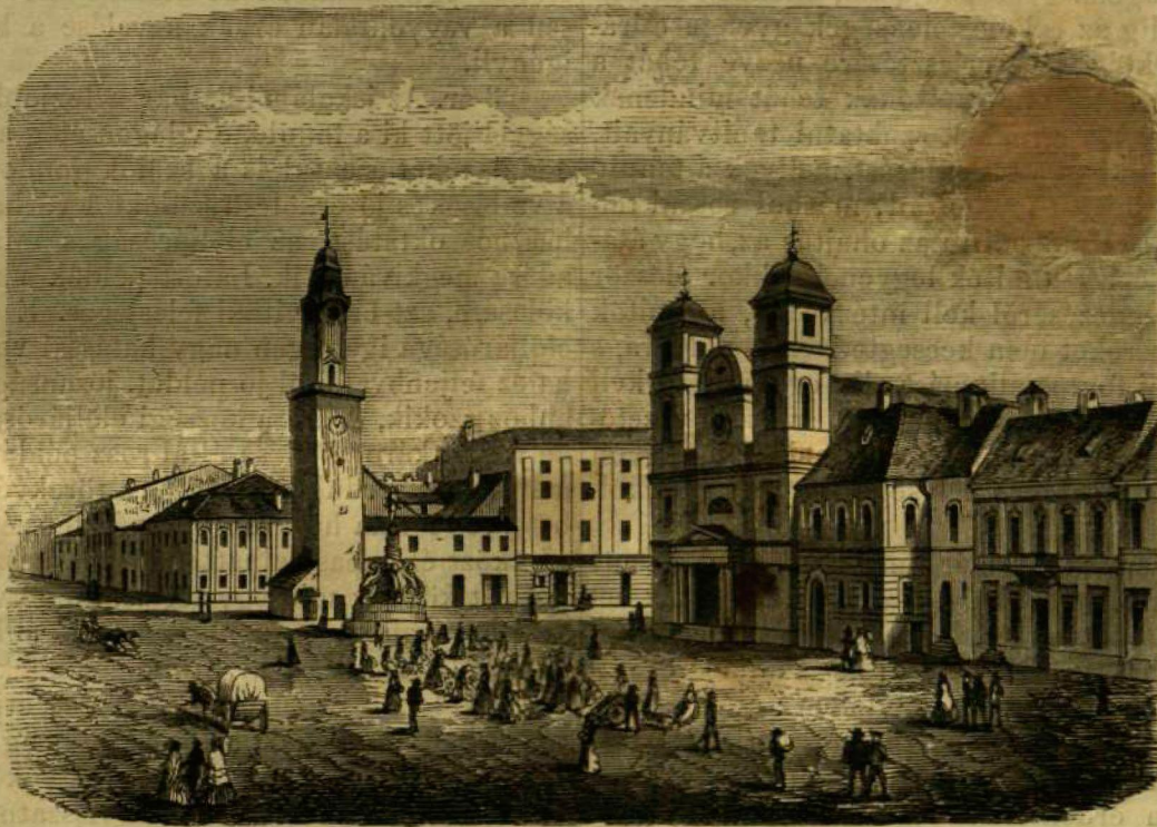
Besztercebányai piac és székesegyház.