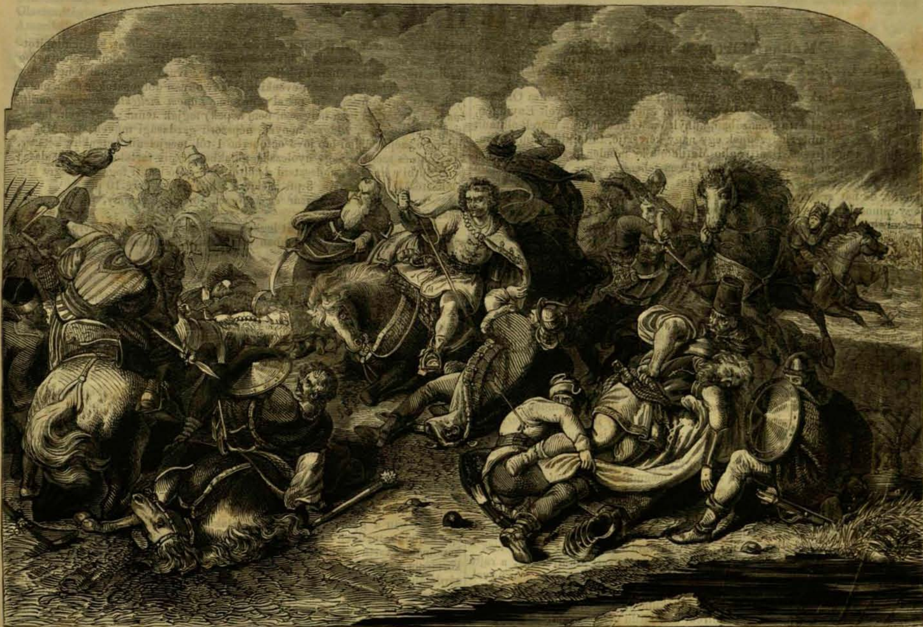
A MOHÁCSI CSATA.

Hajh, mily iszonyu kép!... itt egy véres ala: Térdre áll, s ajkai imára nyilának, Feltekint az égre s aztán... vége, vége! Ott a másik átkot szór a vad törökre S elnémul örökre.