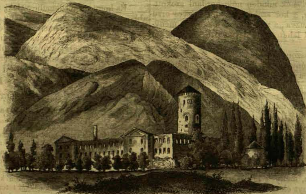
A budetini várromok.