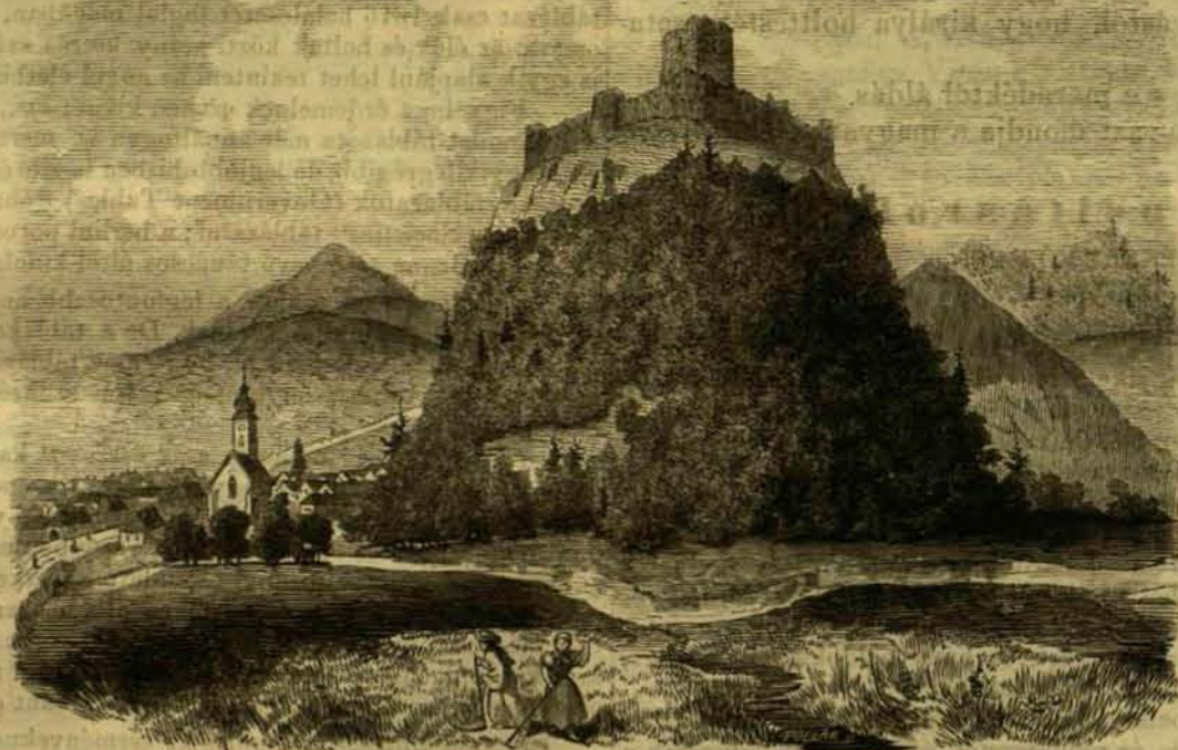
A sárosi vár romjai.

A baromfi-tenyésztés nemes szenvedélyének ápolása magától az angol királynőtől indult ki, a kiben népe különben is annyi sok más házi és személyes erény képviselőjét tanulta tisztelni és szeretni. A királynő egy külön nagyszerű baromfiudvart tart Windsor kastélyában, melyben nagy gonddal ápol, válogatott, drága szárnyasai sok millió embertől méltán irigyelhető pompás életet