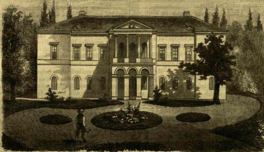
Csallóközi uti-képek: 2. A gombai kastély.

Fell vidékén mindinkább látni már a szabálytalan dunai ár pusztítását. A mint a folyó majd erre, majd amarra veszi útját, kiszáradt medrét mindannyi homoksivatagok