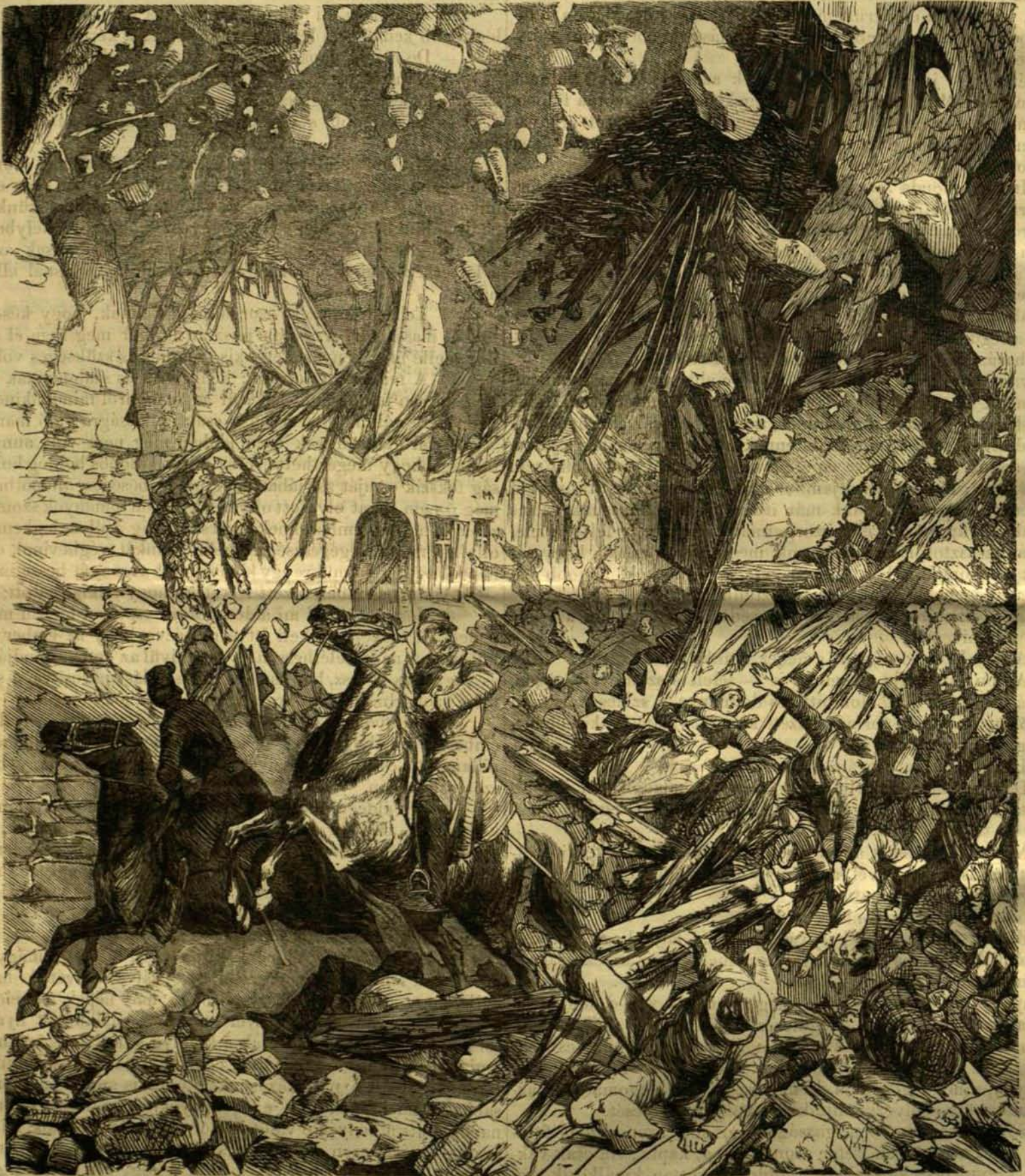
A mainezi löportöröny fellobbonása. — (Lásd a szívet 18. oldalon.)

miként foly a világ sora az urak majorjában is. Magam is béresgazda voltam egy némelly uraságnál, s láttam milly gyorsan gyarapodik az olyan ember, ki jól kezdheti dolgát. Azon ur is, kiről szólok, egyszerre csak itt termett közöttünk, megvett a grófunktól egy egész dülő földet, aztán szép házat, derék épületeket, istállókat s takarmány csűröket rakatott téglából új birtokára, még az ekéket