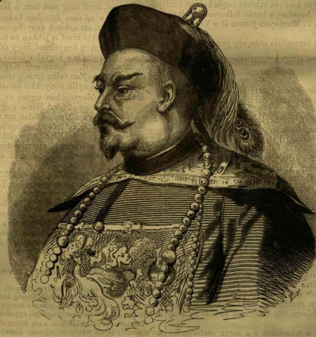
Yeh, Kanton alkirálya.