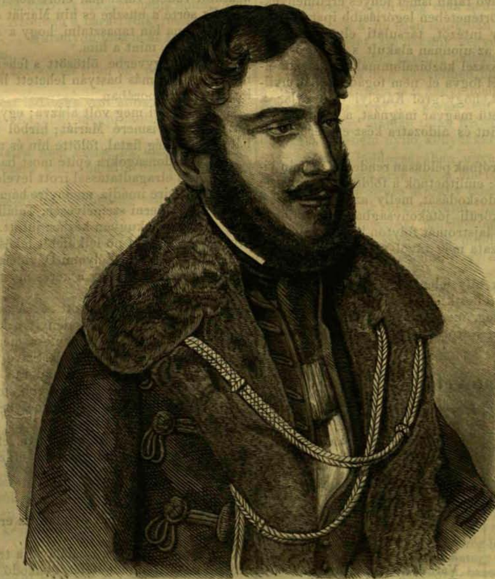
GRÓF KÁROLYI GYÖRGY.

Visszatérvén ezután a sokat tapasztalt és látott férfi, reá nézve is a meg-