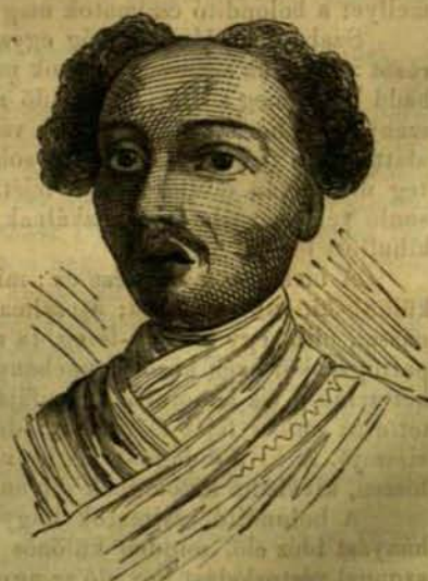
Loyola viasz képmása.