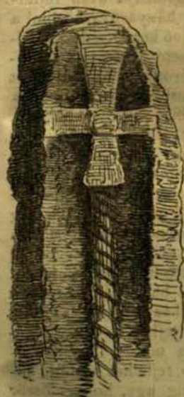
Endre király sarkeresztje.

E kolostort a Bencze szerzet birja, mellynek derék tagjai s kitünő igazgatója előzékeny szíveességgel mutatja meg vendégei előtt a kolostor történelmi emlékeit; a pompás templom alatt van az épület legrégebb emléke, az I. Endre által épített templom, melly most tulajdonkép sirbolt, a hegy-ives boltozatok egyike alatt lát-