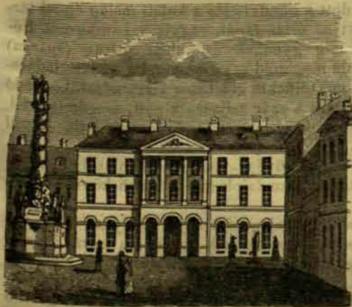
A megyeház Sopronban.

Vége megemlítendő még azon nagyszerű tűzveszélyek, melyek 1676-ban és 1808-ban kitörttek, és majd az egész