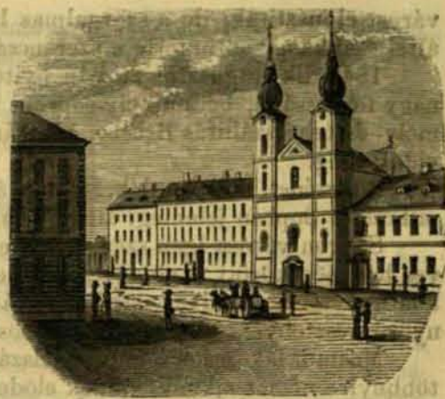
A Domokosok egyháza Sopronban.

1635-ben még egy országgyűlést láttak Sopron falai. Azon időben Sopront kapitányok kormányozták, s egy mindig kész fegyveres hadat tartottak, s ez által sikerült nekik a Rákóczy és Tököly háboruk nyomoruságait diadalmasan kiállani. E kapitányok közül Dobler tünteté ki magát leginkább vitézségével, ki a várost Rákóczynak sokáig ostromló csapataitól megmentette, mely kitaró hűségeért I. József és III. Károly a soproniakat meg is di-