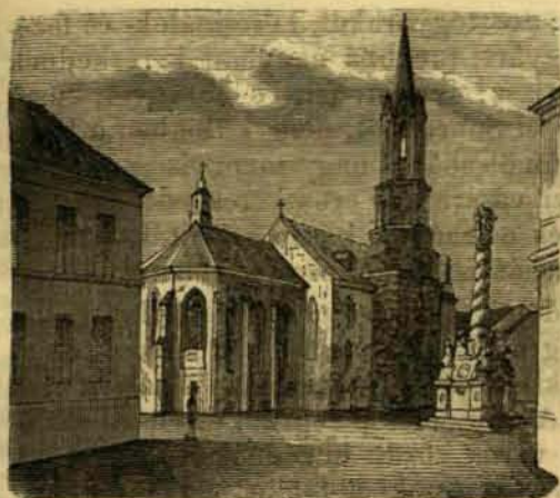
A Benczék egyháza Sopronban.

1493-ban Ulászló néhány faluval ajándékozta meg a várost, melyeket maig is bir. — 1553-ban Ferdinánd a honvédelem iránti tanácskozmányok végetti országgyűlést Sopronban, mint legbiztosabb helyen tartatá.