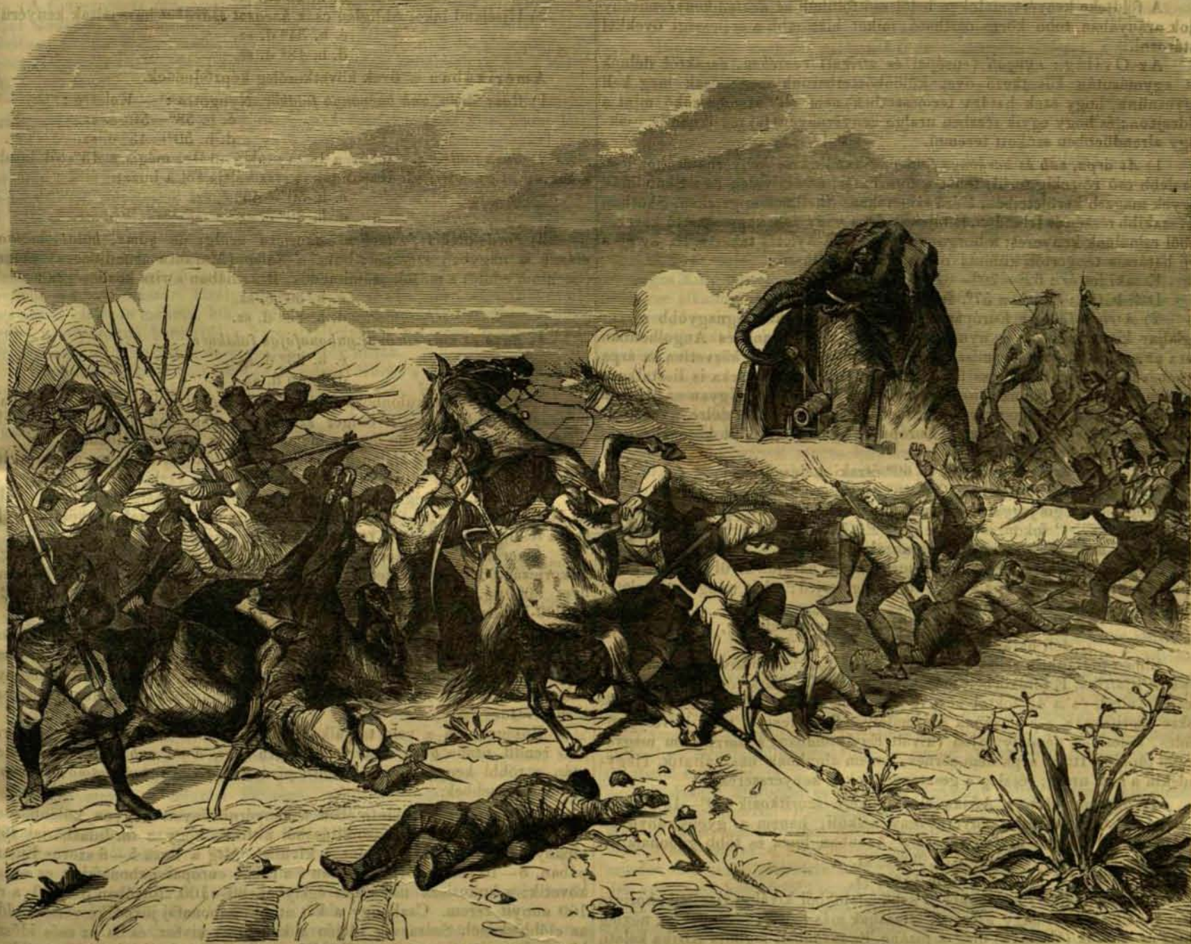
Egy elefánt vitésége a keletindiai háboruban.

Ugyanezen lisztanyag, határozottabb neven keményő (Amylon, Stärkmehl), majd a növénymagvak ssikeiben , azon levélszerű részekben, mik a csírárt fejlődés idején borítják, például bab, borsó, dió,ogyoró, gesztenye és makkokban; majd ama fehérnye testben, mely a magburokban az egész csírárt magában foglalja, péld. gabonafajokban, tatárkában, kokuszdióban; majd a magborékban (tulajd. gyümölcsben) péld. kenyérialma, pizáng, datolya sz.