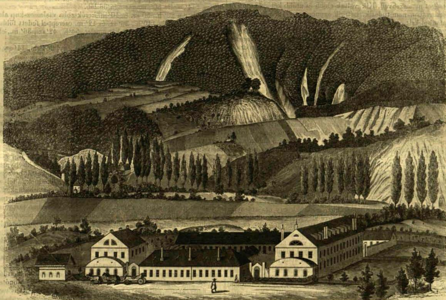
A zay-ugróci postógyár. — (Lásd a szöveget 510. oldalon.)

Zrinyi nem eléglé, hogy megmutatta, miként nem kell viselni háborut a törökkel, annak helyes módját is föl akarta tárni vakoskodó, idegenekben bizó nemzetének. Látta, hogy az udvar kellemes álmokban ringatja magát, hogy a hazafiak közül is többen békét reménylenek; mert az Erdélybe alkudozni küldött váci püspök, noha tömlöczben halt meg, fegyverszünetet eszközölt. Ezek ellenében Zrinyi háborut sürgetett és a szó gyöngye fegyvere helyett ismét tollhoz nyult. Croesus néma fiához hasonlítja magát, kinek atyja veszedelme szavát visszaadta. „ Látok egy rettenetes sárkányt . . . melly kapóul és ölében viseli a magyar koronát; én csaknem mint egy néma, kinek semmi professióm a mesterséges szólásra nincsen, felkiáltok mindazonáltal, ha kiáltásommal eljeshetném: ne bánts a magyart! Háboru kell nekünk, Várad és Erdély, de nem idegen segítséggel. A német ellensége a ma-