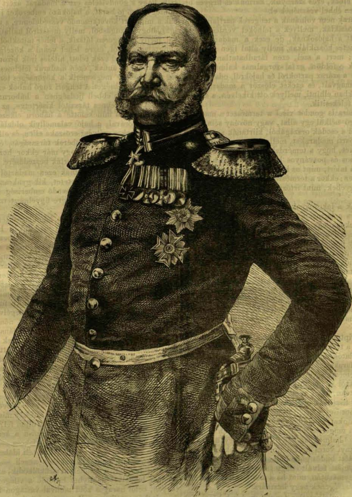
VILMOS, Poroszország régens hercege.

Hogy a víz alá buvhassanak, szemük, tüdejük, másforma, mint a több állatoké. Hogy eledelüket elérhessék, hosszabb nyakuk, szélesebb orruk, másforma nyelvük, torkuk és begyük van. Hogy