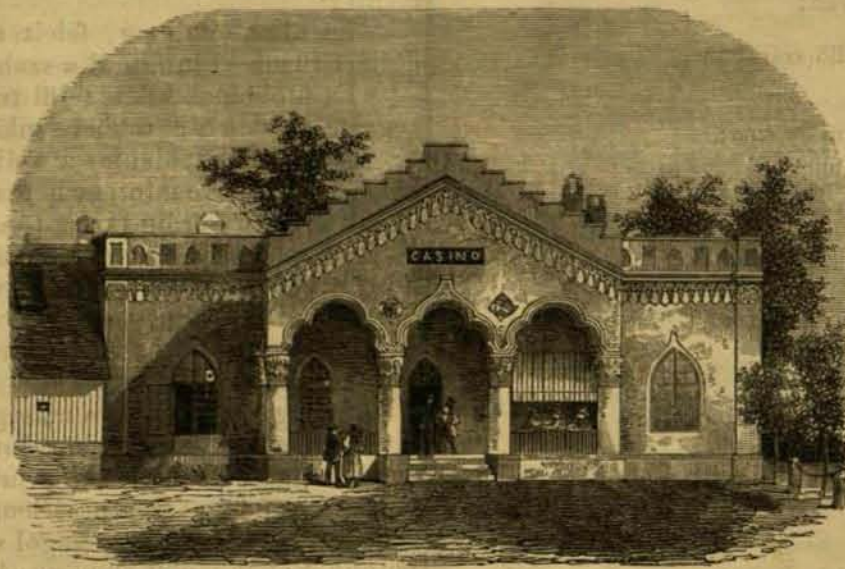
A bajai casino.

lett kapott egy telket helyiség építésére, hogy a szükséges téglák és mészanyagokat a város fogja adni, és a felépítendő helyiséget a társulat tiz évig ingyen fogja használni, tiz év után pedig a város tulajdonává válik. A téglák és mészanyagokon kívül az épület felállításához szükséges pénzerőt a társulat két pftos részvény útján hitte legczélszerűbben kivihetőnek, a mit a társulat tagjai készségelesen fel is karoltak, és csakhamar szép összeget adtak össze, olly feltétel mellett azonban, hogy idővel a társulat pénztá-