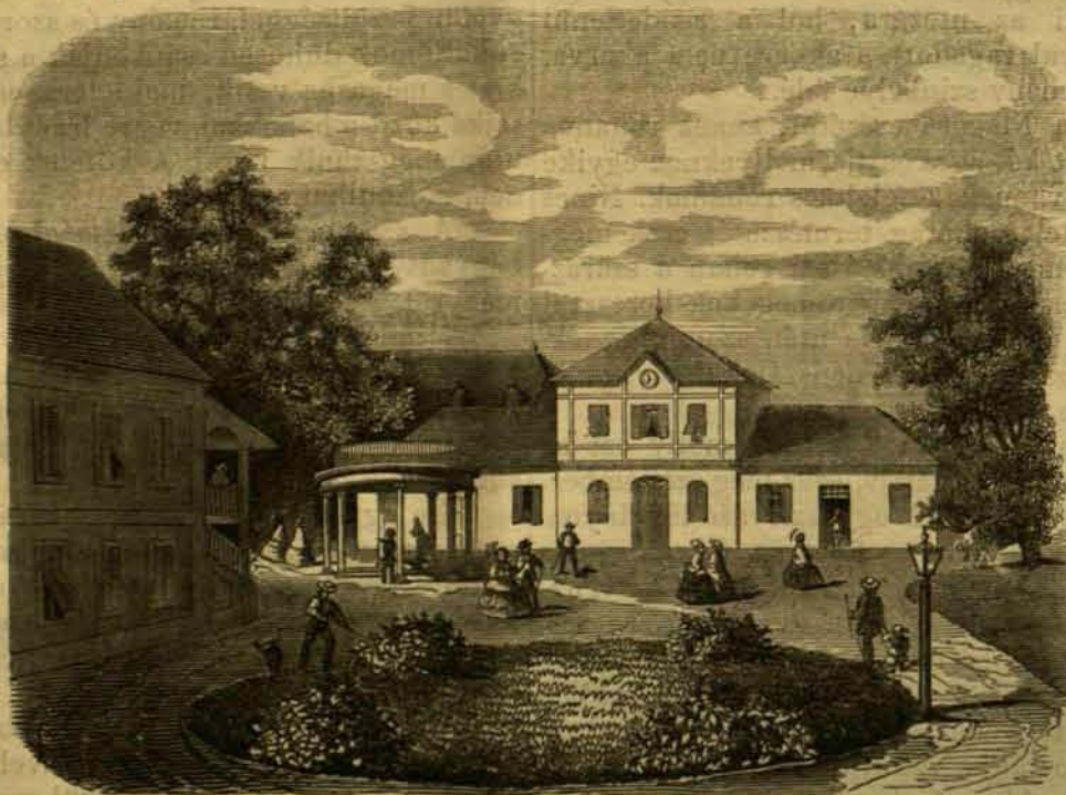
Felső-vasmegeyi képek: IV. A tarsai fürdő.