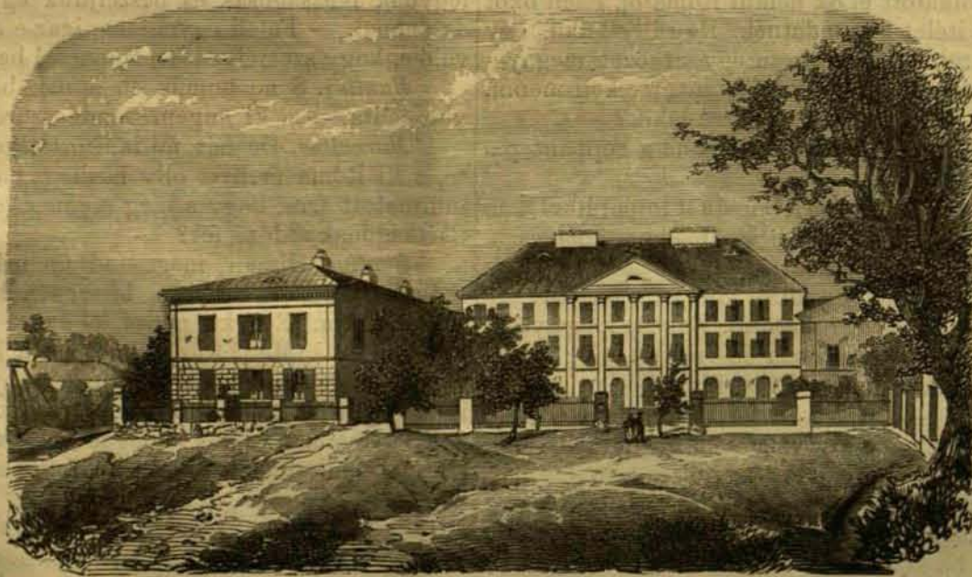
Felső-vasmegyei képek: V. Felső-Lő. — (Lásd a szöveget 78. oldalon.)