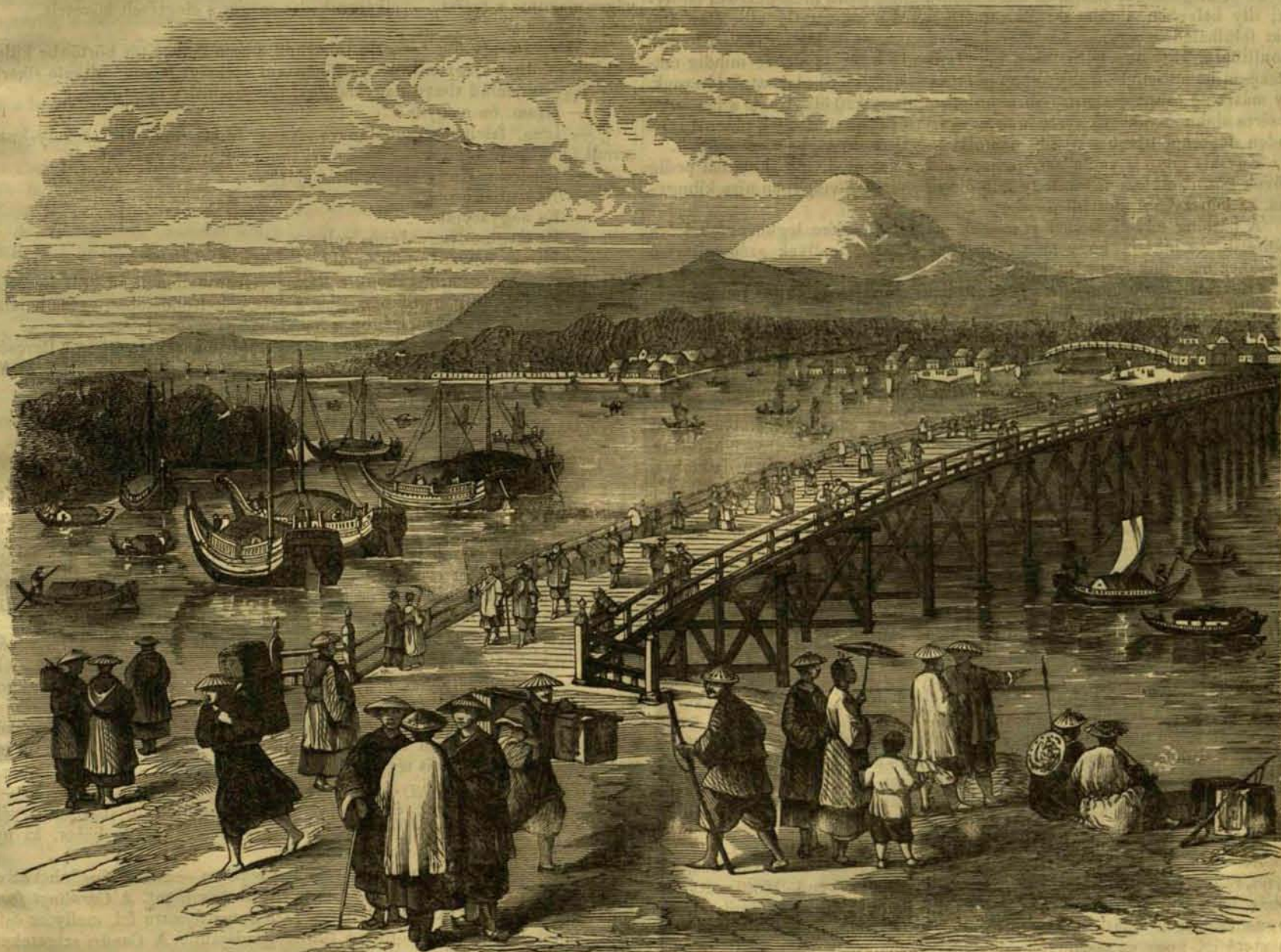
Képek Japánból: Jeddo. — (Lásd a szöveget 162. oldalon.)

Éa részemről Dél-Biharmegyének eddig ismert barlangjait, jelesen a