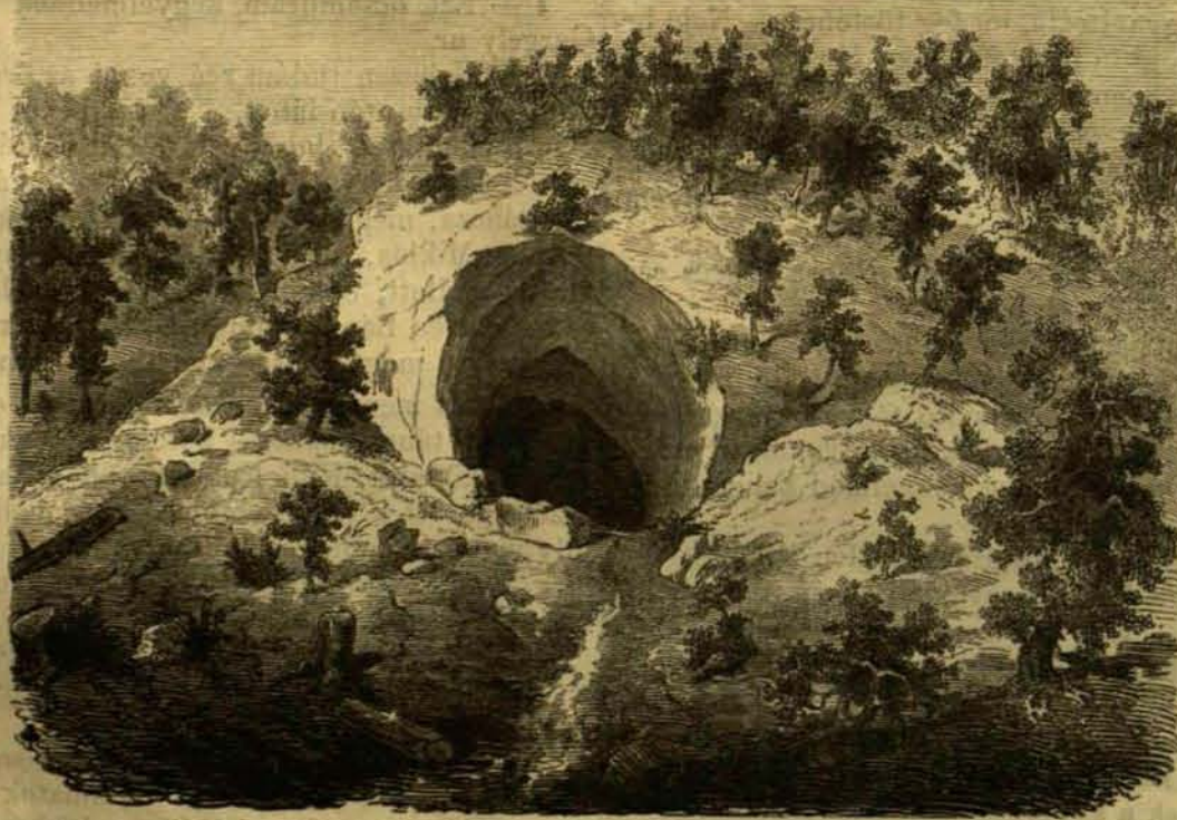
A meziádi barlang, kívülről tekintve.