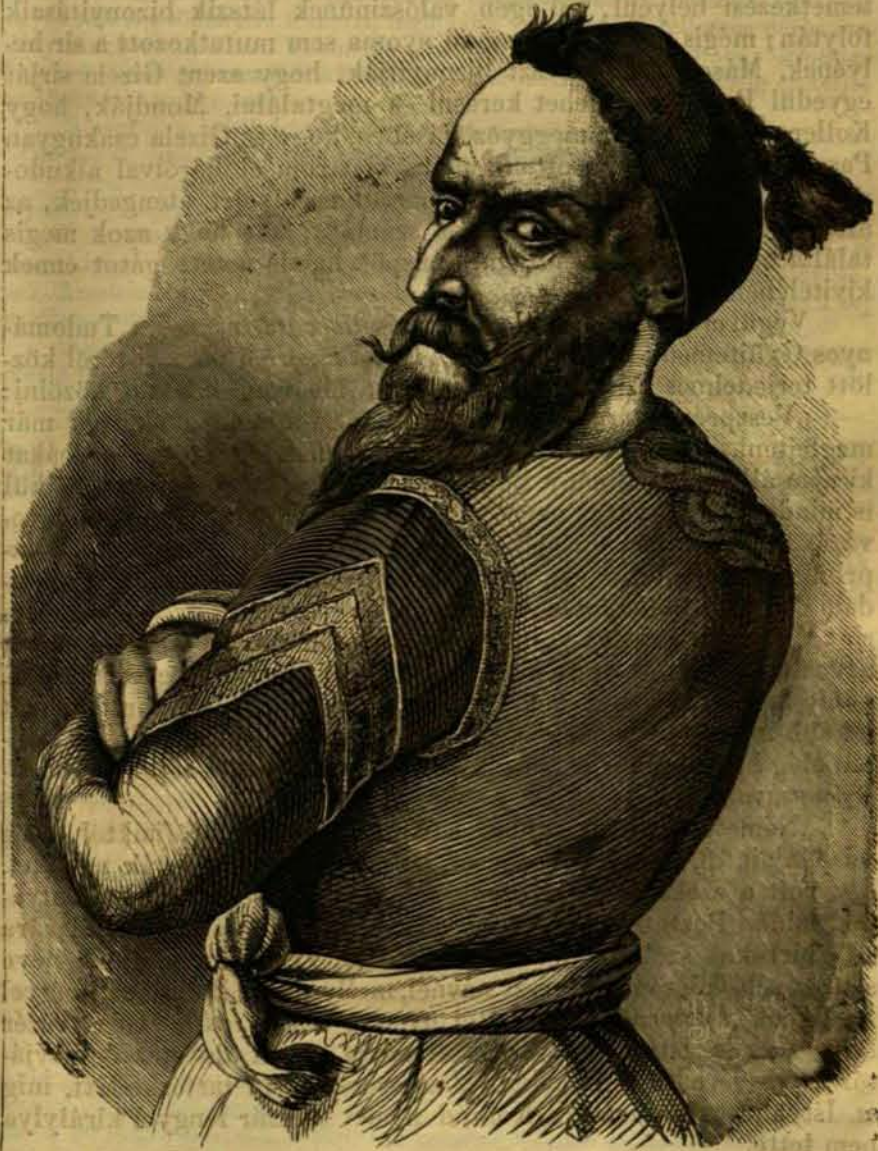
Egy zuáv arczképe. (Természet után.)

Igen természetes volt, hogy midőn a törökök 1552-ben Veszprémig nyomultak és az egész megyét elfoglalták, a külváros sem kerülhetett el végpusztulását, és miután 1598-ban a vár és környéke visszafoglaltatott, a város újra felépítéséről szó sem lehetett, mert a törökök még mindig a közel vidéken tanyáztak, és a főgond a