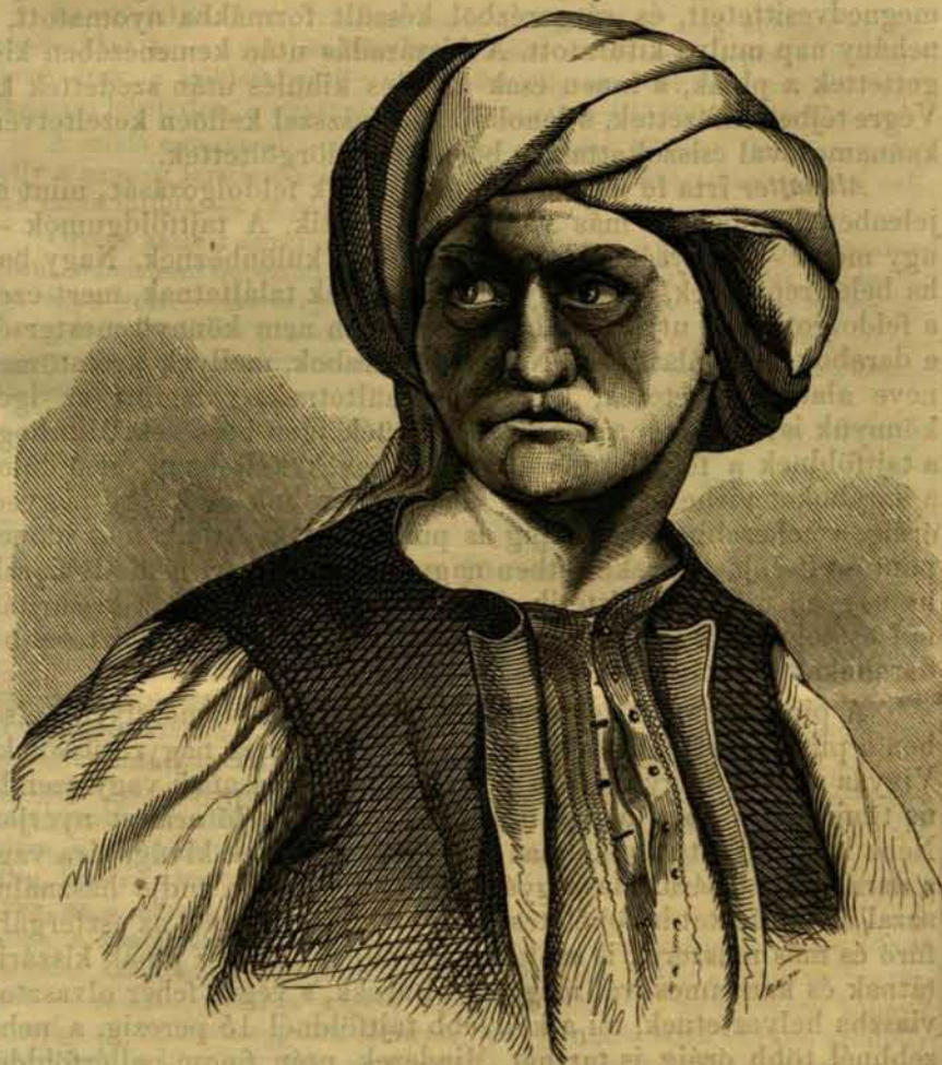
Egy turkó arczképe. (Természet után.)

E kápolna kicsiny ugyan (42 láb hosszú, 10 \frac{1}{2} láb széles és 12 láb 8 hüv. magas); de ha tekintjük tiszta római stíli építészetét, s a falak szép festményeit és diszitményeit, mellyek a XII. századból, vagy még régibb időkből valók, ugy egyikét látjuk benne