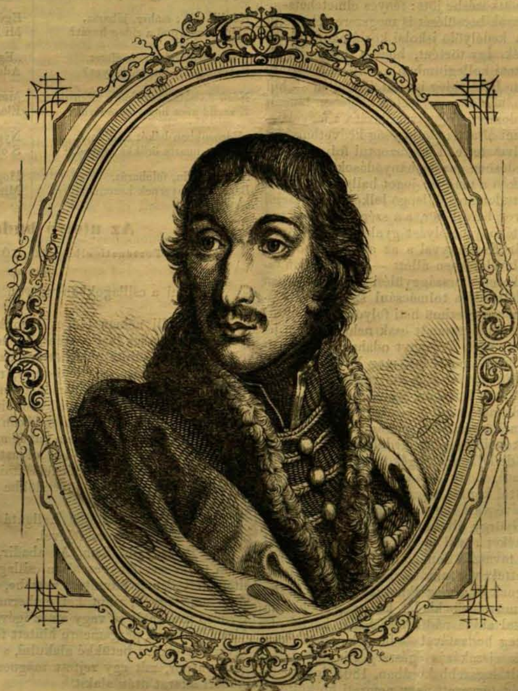
CSOKONAI VITÉZ MIHÁLY.

Két tehetségünk van, mellyek okszerű használata által a boldogságot az emberi társaságban legjobban megközelíthetjük, egyéni tökéletességünket legtovább vihetjük: az ész és a szív ; miből önként következik, hogy e két tehetség kellő iránybani fejlesztése az irodalomnak, mint a közmívelődés leghatalmasabb előmozdítójának, főfő — sőt kizárólagos feladata, annyival is inkább, mivel a köz tanodai pályán — sajnos! — minden figyelem inkább csak az ész kimivelésére levén fordítva, a szív ápolására igen kevés marad, s így a tanodák e tekintetbeni mulasztását is az irodalomnak kell lehetőleg helyrehozni. Önként értetik már, hogy a kettős cél elérhetésére két különböző ut vezet, s míg az elme kifejtését, ismeretkörünk rendszeres gyarapítását a tudományos irodalom eszközli: a szív ,