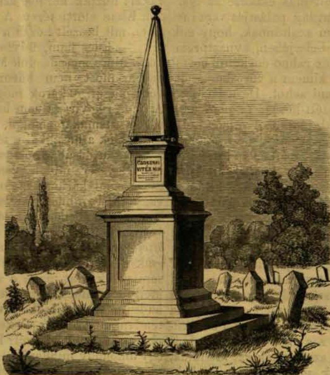
Csokonai Vitéz Mihály sirja Debreczenben.