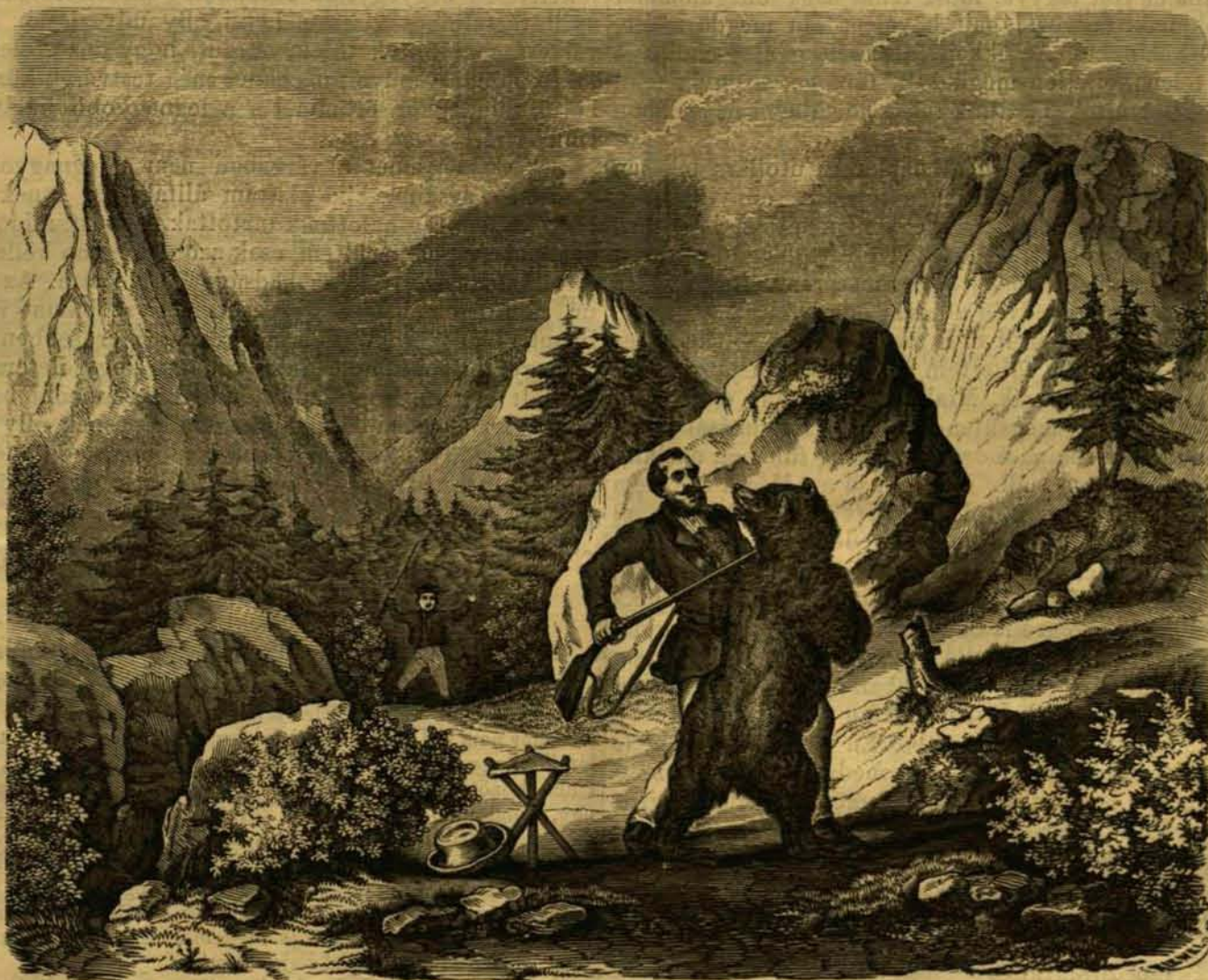
Egy medve karjai közt.

el nem érték. Itt a sajkát minden fényűzési czikkkel együtt hátrahagyták, s magukat a legnélkülözhetlenebb tárgyakkal ellátva megkezdék kalandos vadászataikat az ösrengeteg sűrű vadonjában. — Végre elértek a „Felső-tó“ kezdetéhez, hol egy borkereskedő sajkájába ültek, melly épen a tó alsó végére való indulandó. A lefelé utazás több napig tartott. Éjjelre a sajka a parthoz lön kötve; a jó kedvű vadászok pedig pattogó tűz körül vi-