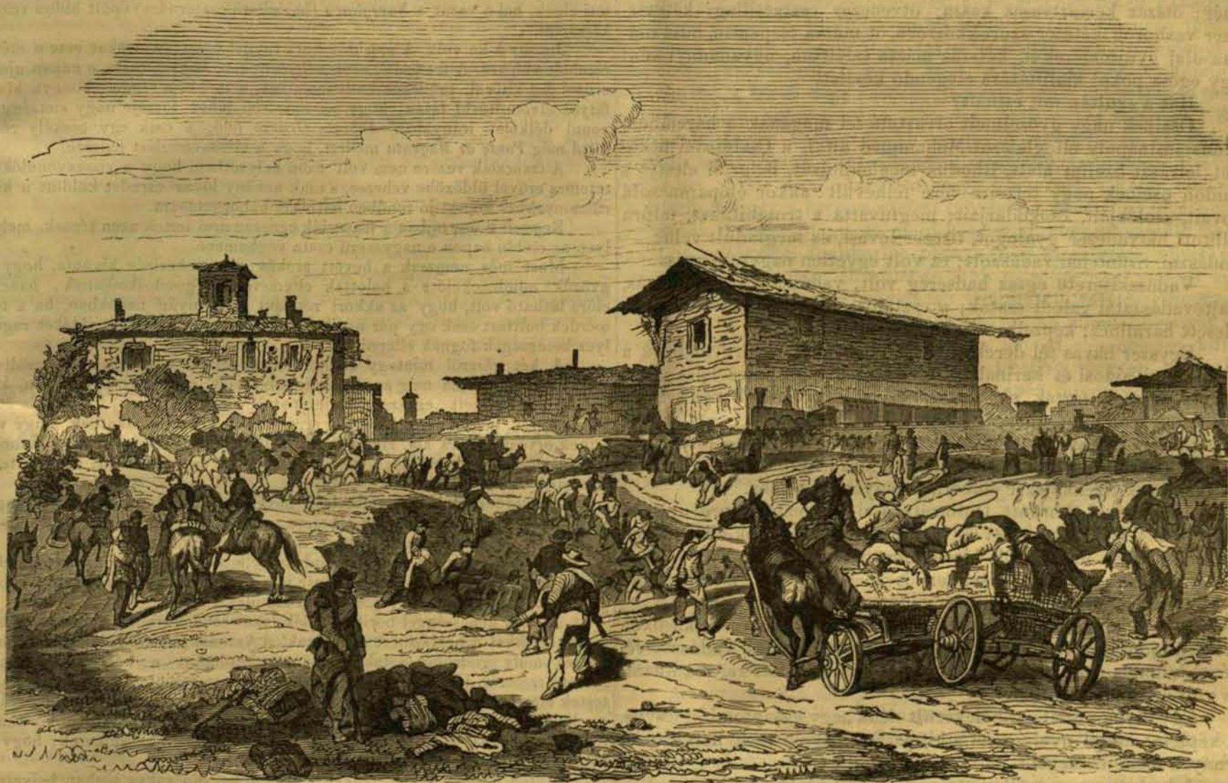
Visszapillantások az olasz hadjáratra: A halottak eltemetése. — (Lásd a szöveget 510. lapon.)

Reszkettek-e Buda várának falai, romlásuk előérzetében? hajladozott-e a lófarkas zászló a palota ormán szélcsendes időben? nem égtek-e az aranyozott betűk a szerály ajtai fölött, valahány-