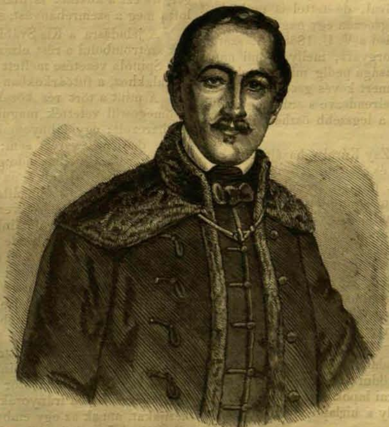
GRÓF ZAY KÁROLY.

Politikai szereplése 1825-ben kezdődött; ezen év volt az újraébredés és addig ismeretlen, számos jeles hazafi és értelmiség szülő éve. Gróf Zay Károly is az 18 25/27 -i országgyűlésen lépett fel először mint törvényhozó. Ő már akkor a szabadelmű ellenzékhez csatlakozott, melly pártnak állandó hive maradt mind végig. A vallásos és polgári szabadság, valamint a nemzetiség szilárdítása körül buzgólkodott szónokok között, a mindig lovasias és nemes egyenességű gróf Zay Károlynál buzgóbbat és határozottabb színezetű országgyűlési férfaink sorában állg ta-