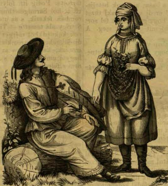
Hazai népviseletek : VII. Szászvárosi oláhok.

E féreg északi Svédországban Botnia fügazdag posványában tartózkodik; mintha csak a légből esett volna le, hirtelen befuródik az ember és állat testébe és megöli azt nem ritkán negyed-óra alatt. E féreg czérnaszál alakú s mint a haj, olly erős, hengeridomu testtel birt, mindkét oldalról egy sor szőrrel s végre visszahajtott fulánkokkal volt ellátva. Hossza mint egy közönséges szögé, színe mint az emberi testé s két vége fekete. A növényekre mászik fel, honnét a szél és vihar elkapja s ha emberi vagy állati testre esik le, oda azonnal befurja magát; első szurása egy alig látható, jelentéktelen fekete pontként tűnik fel. De csakhamar el kezd viszketni, s később a legborzasztóbb fájdalmakat okozza. Vörös folt, daganat támad, s lázt von maga után, melly az örültségig emelkedik s gyors segély nélkül halált idéz elő. Csak a féreg kihuzása,