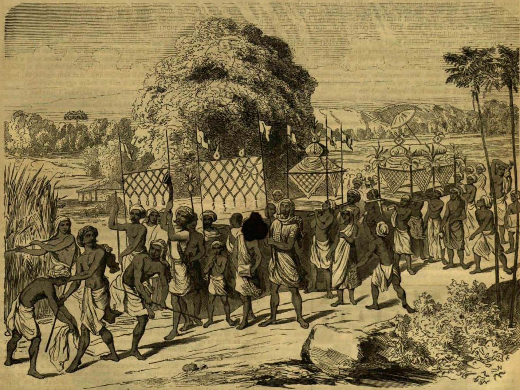
Hindu temetési szertartás.

Szorosan a gyászravatal mellett két férfi megy nagy lepedőkkel, szüntelen legyezve a koporsót, mintha a halottra hűs leget hajtani, avagy arról