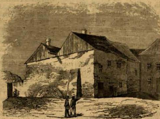
Fehérhegyeségi utiképek : Vak Béla szülőháza.

Egész Szakolcza városa ujjal mutat egyik főutcájának, mindjárt az öreg piacra kitekintő azon bedőlt-kidőlt falú nevezetes nemesi kuriájára, melynek romlakjait itt képen adjuk (l. a mellékelt képet); s a mily ingerült ellene, hogy rozszant, kormos, ódon falival csinos városuk közepét csufítja; melyhez mint nemesi kuriához eddig a jó polgárok nem is igen férhettek, — mégis épen oly büszkén beszél róla, hogy ezen házban született hajdan Vak Béla királyunk, Álmos fia, ki azután szülőhelye iránti hálából Szakolczát várossá emelte. Így már II. András és IV. Béla ideje előtt,