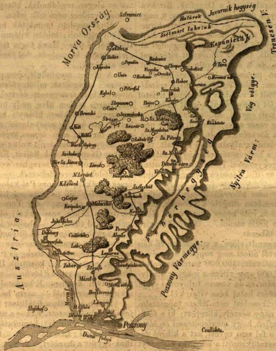
Fehérhegység térképe. (Az Utképek I. részéből újra közölve.)