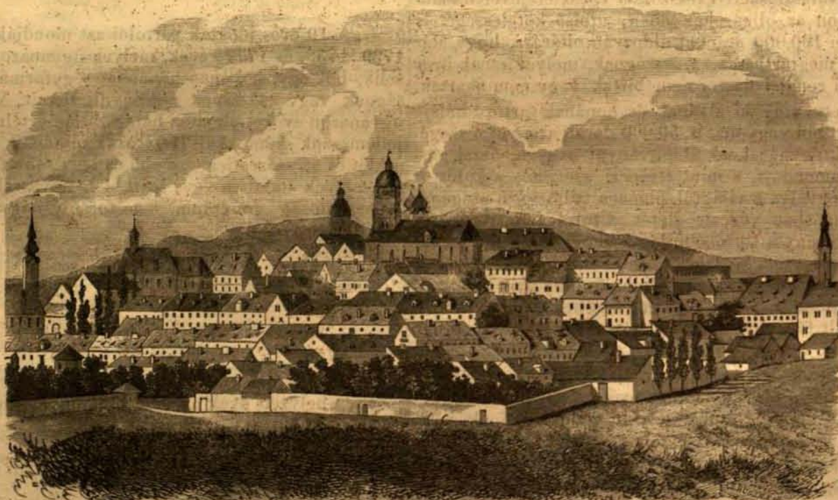
Fehérhegyeségi utiképek : Szakolcza.

caruariumoknak nevezve, már a XI. század óta közönségesen az egyházak, vagy várak melletti temetők közepén emelkedtek; és míg lámpatornyocskáikban az örökmécses a halottak lelki üdvéért égett, addig éjben a környék népének és utasoknak irányvilágítóul is szolgált. De ezen régi becses építészeti emléken is, mely hazánkban már párját ritkítja, készek vagyunk az egyszerű alkudozni. A közel Csehországban