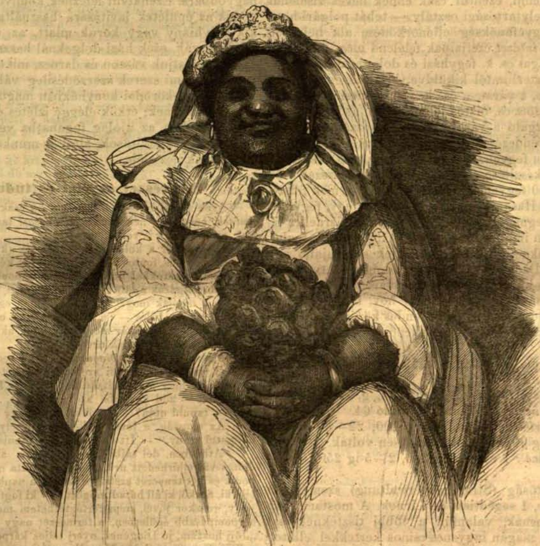
Pomare, Tahiti-sziget királynője.