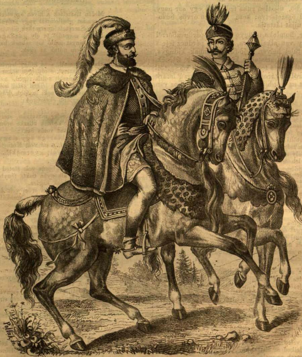
Magyar diszviselet a XVI. századból.

Ünnepélyeken és csatákban egyaránt fényesen és délczezen jelentek meg őseink, halálban vagy győzelemben mindig diszesen öltözve vettek részt. Ez állítást igazolják nemcsak azon gazdag és diszes fegyverek, vérték, sisakok, pompás ruhadarabok, melyek őseinktől fenmaradtak, de történetünk lapjai is bizonyítják. Őseink fényezéséről gyakran