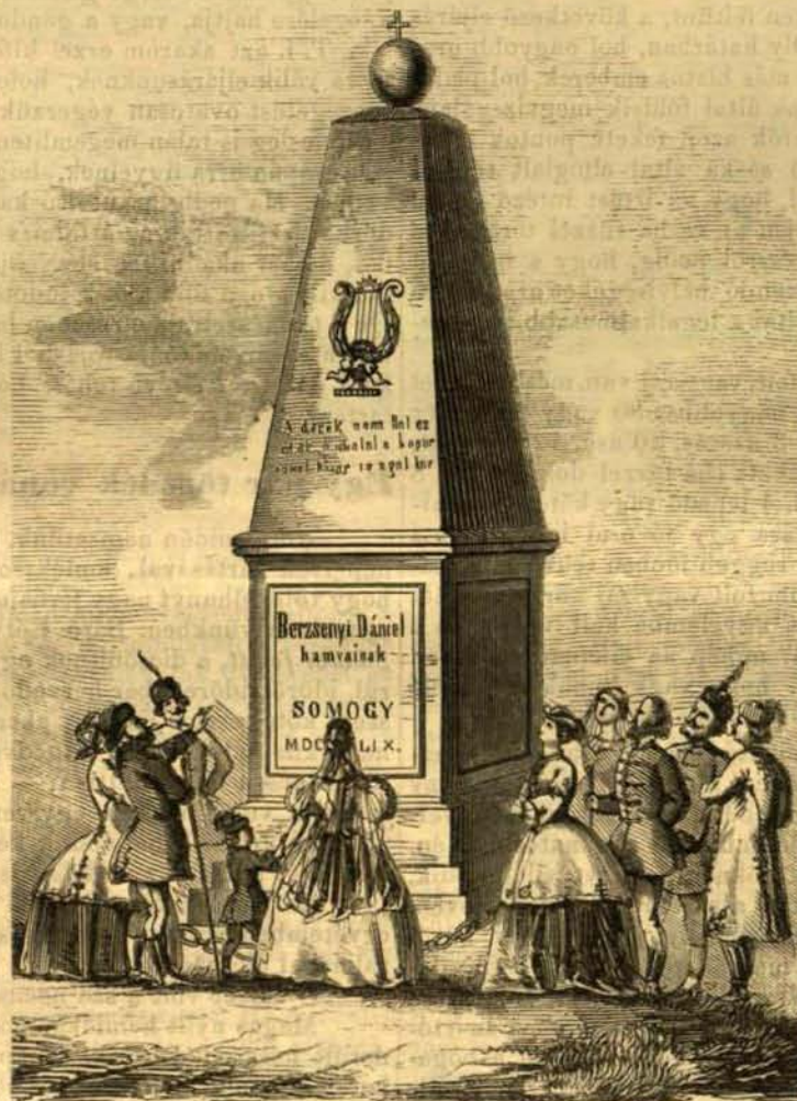
Berzsenyi Dániel síremléke Niklán. (Lásd a szöveget 311. lapon.)