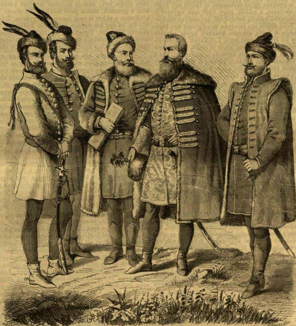
Magyar viseletek a XVII. század közepéről.

A XVII. században a magyar viselet ismét visszanyervén eredeti sajátosságait, egyszerűbb és nemesebb izléssel, a kor és kényelem igényeihez alkalmazva, új alakot nyert. — A mult századokban használt kényelmetlen hosszú öltönyök, és a felső ruhák tulságosan hosszú ujjai rövidebbre, de egyszersmind bővebbre szabattak. A tulságos fényűzést mérséklik a harcias idők és a kor izlése, mely inkább czélszerűséget, mint fényűzést tett kívánatossá a viseletre nézve. — Bárha egy részt a fényűzést csökkenté is a kor befolyása, de másrészt az emelkedő ipar és a nyugati divat sem maradhattak befolyás nélkül viseletünkre, a mennyiben a ruházatnak legalább egyes részeibengyakori változásokat idéztek elő. — És valóban adataink nyomán nagy változatosságot fedezhetni fel a ruházatban egy párévtized alatt is, — de mely utóbb a nyugati divatokhoz mindinkább alkalmazkodva, annak minden dőreségeit utánozta