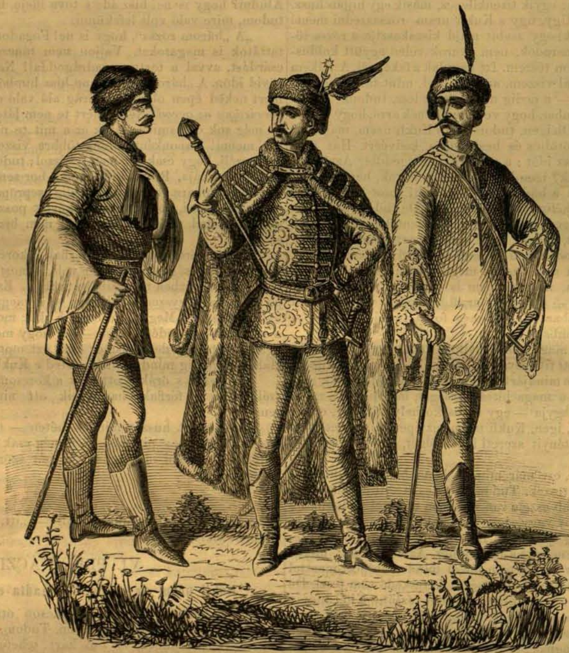
Magyar viseletek a XVIII. század elejéről.

„Végre valahára, „igy ír Kukli uram, „még is csak elaludtam s azt álmodtam, hogy az ég egy halhéljakra feszített iszonyu nagy darab zöld selyemmé változott és az egész világ ezen esernyőszörny körül forgott.“