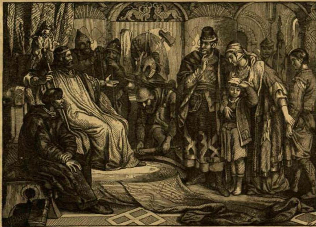
GYULA VEZÉR CSALÁDJA I. ISTVÁN KIRÁLY FOGSÁGÁBAN.

Betűk régebben voltak, mint a magyaroknak, felülről lefelé írtak velök, kihagyva a magánhangzókat, három je-