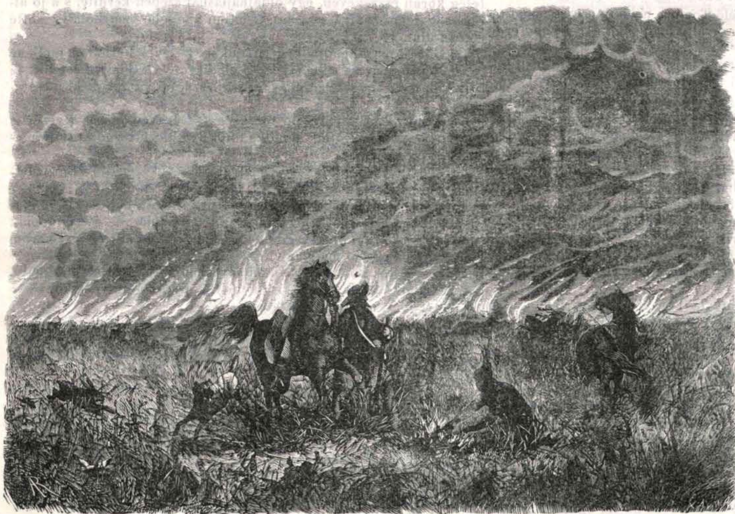
Mezőégés nyugati Északamerikában.

Sokáig álltam ott, nagy csodálkozással szemlélve a magasztos látványt; ugylátszik indián társaim sem voltak egészen éréktelenek hasonló benyo-