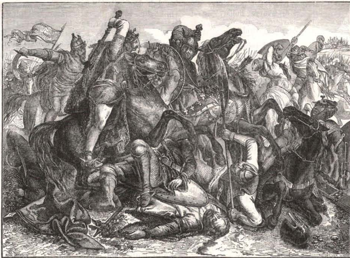
ÁRPÁD CSATÁJA ZALÁN, BOLGÁR FEJEDELEMMEL.

Zalán , Symon vajdával egyesülve, fegyveres daczczal lépett fel a hódító ellen, visszakövetelve a Sajó melléki földet, mit egykor önkényt engedett neki át, s az Alpári mezőn, mely-