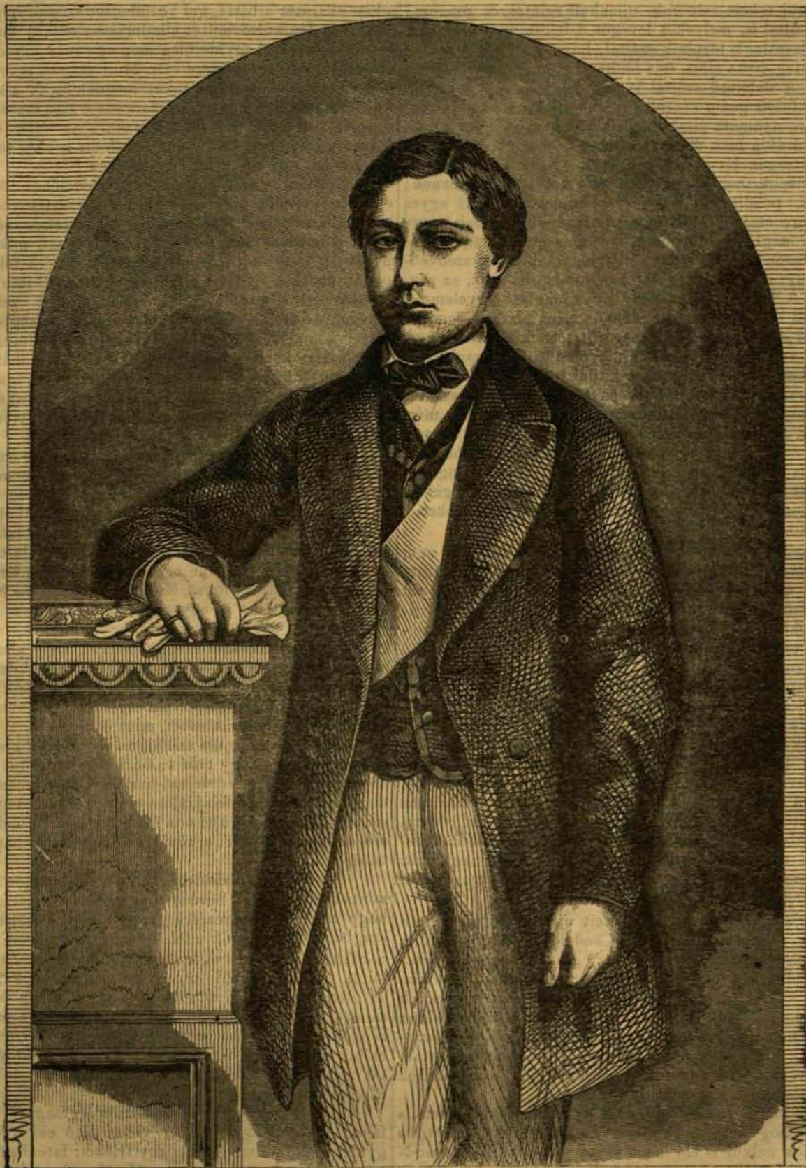
EDUARD ALBERT WALEISI HERCZEG, AZ ANGOL TRÓNÖRÖKÖS.