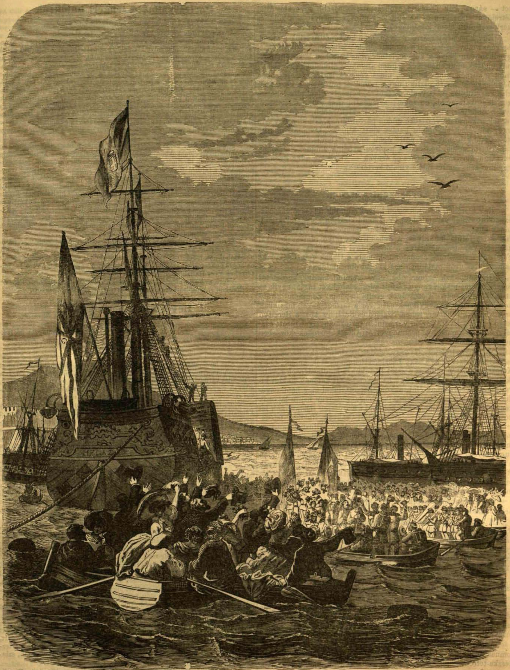
Partraszállása az angol önkénteseknek Nápolyban, október 14-én. — (Lásd a szöveget 610. lapon.)