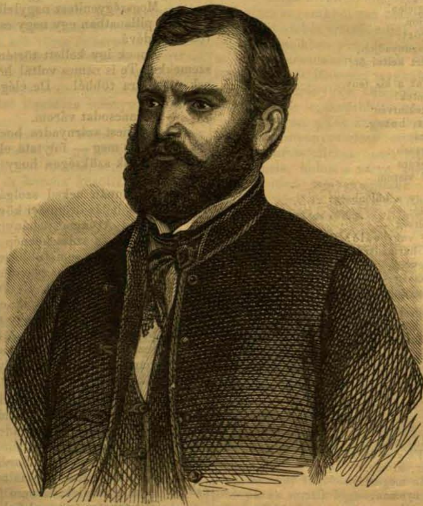
Ifj. MAILÁTH GYÖRGY.

Az 1843-ki országgyűlésre ismét közakarattal választatott Baranyamegye követévé. Ezen országgyűlés, ámbár az azon kifejtett sok eszme közöl csak kevés alakult törvénynyé, miután az irányok ellentéte élesebb volt mint valaha, és Deák távollétében hiányzott a közvetítő erő — mégis a legnevezetesebbek egyike nemzetünk fejlődésében; s abban Mailáth oly tevékeny és kiváló részt vön, mely politikai elleneinek is rokonszenvét vagy legalább elismerését vitta ki. Különösen az akkor kitört nemzetiségi surlódásokban, a horvátokkali gyászos vitákban Mailáth oly államférfiui állást foglalt el, mely az akkori ingerültségben is, ha követésre nem, de legalább méltánylatra talált; s a mai nemzedéknek e tárgyban szabadabb elvü s politikailag helyesebb nézeteivel teljesen azonos.