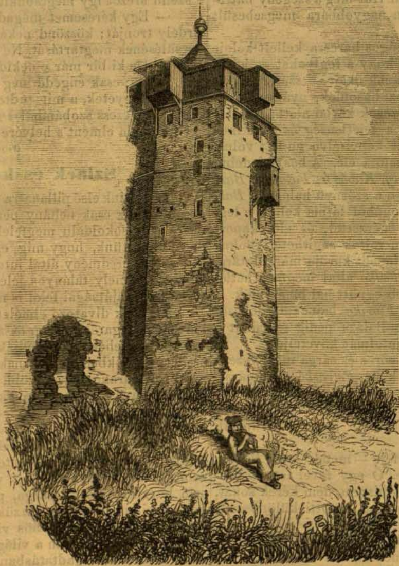
A körösszegi várrom. — (Lásd a szöveget 610. lapon.)

Ha emberi alaknál párosítunk szint testi domborúsággal: elveszszük művészeti becsét végképen, de ha egy tájképet ruházunk fel testi valósággal, az megtartja szépségét, csak hogy a festészeti tárgy helyett, most kertészeti remek van előttünk: míg előbb a festész érdeme volt, összhangzatba hoznia bérczek távolba vesző alakzatát, a sziklák tömegeit, patakok kanyargását és fesztelen növénycsoportozatokat: úgy most ez mind a kertész művét ékesíti. De képzeljük viszont a kertnek színeit elvéve, nézzük azt, midőn téli hó és zuzmara borítja: e sa-