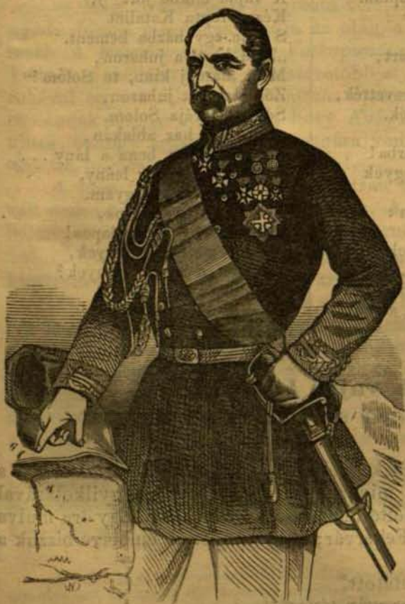
FANTI MANFRÉD, tábornok.

Milanóban tábornokká nevezett, s tagja volt a honvédelmi bizottmálynak. — Azon éjben, melyen a dühös nép, a Greppi palotát ostromlá, Fanti, Károly Albert oldalán maradt, s saját testével védé a megtámadások ellen. A fegyverszünet után Piemontba ment, hol egy dandár bízott reá, az 1849-ki hadjáratban a Lombárdi hadosztályt vezénylé. — Később