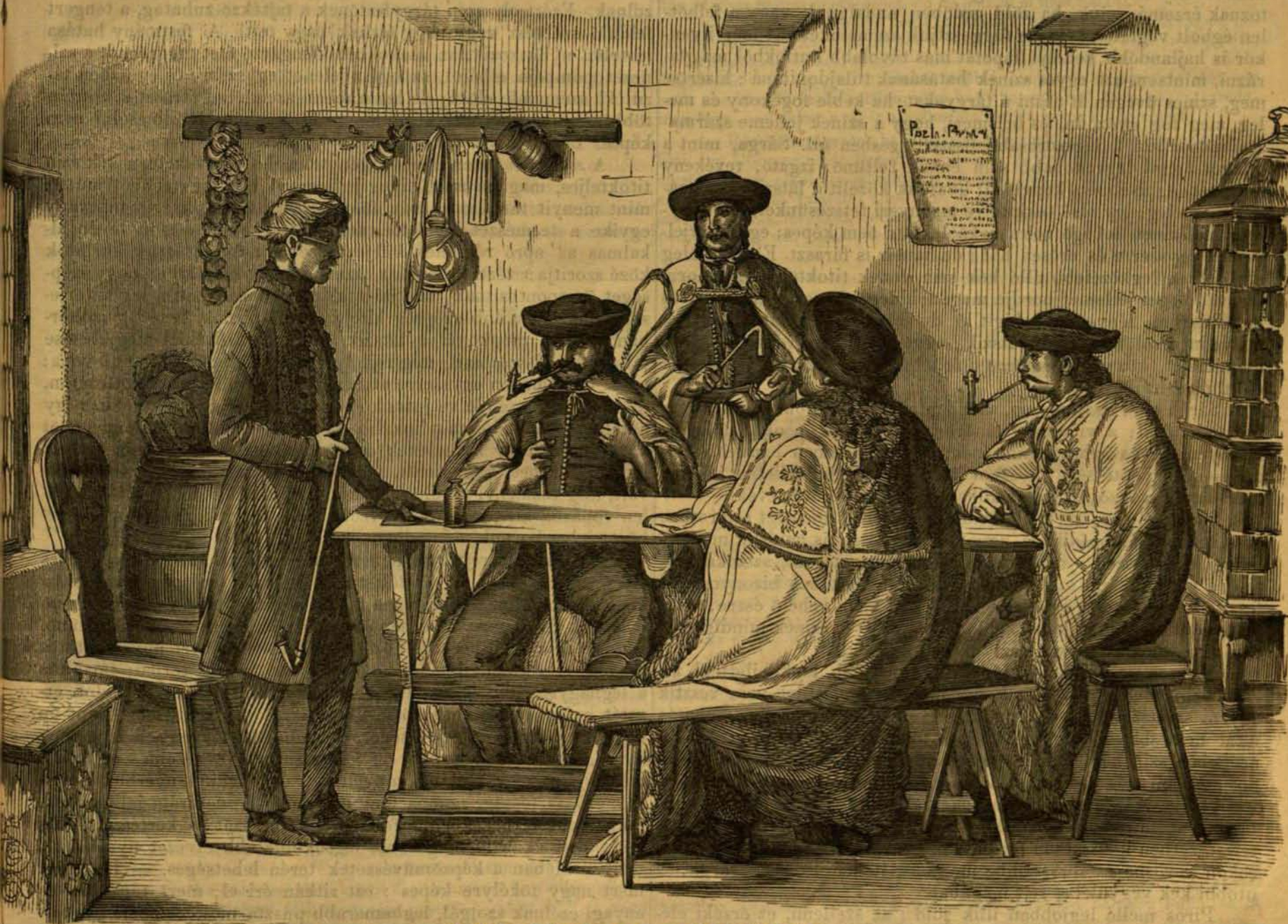
A falusi tanács a korábbi időkben.

Már most elhagyván eddigi szempontunkat, térjünk át tárgyunknak egy más, figyelemreméltóbb, vonzóbb terére : eddig