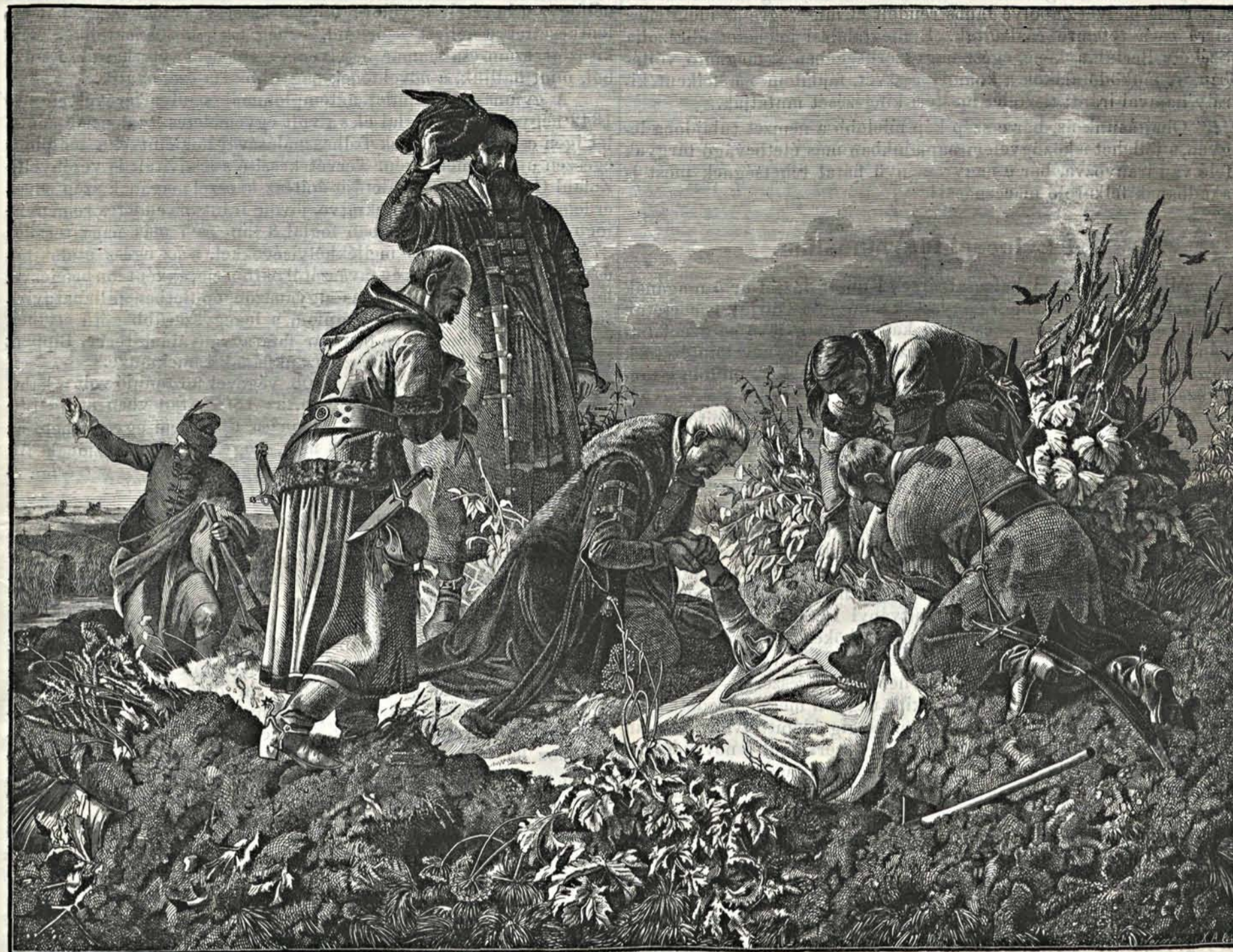
II. LAJOS KIRÁLY HOLTTESTÉNEK FELTALÁLÁSA. (Székely Bertalan festménye után.)

E perczen trombitaharsogás reszketeti meg a levegőt, újból felhangzik a Jézus! Jézus! csatakiáltás, s az Ompoly vize felől derék seregével megjelen Hunyady, a valódi Hunyady, a rettegett