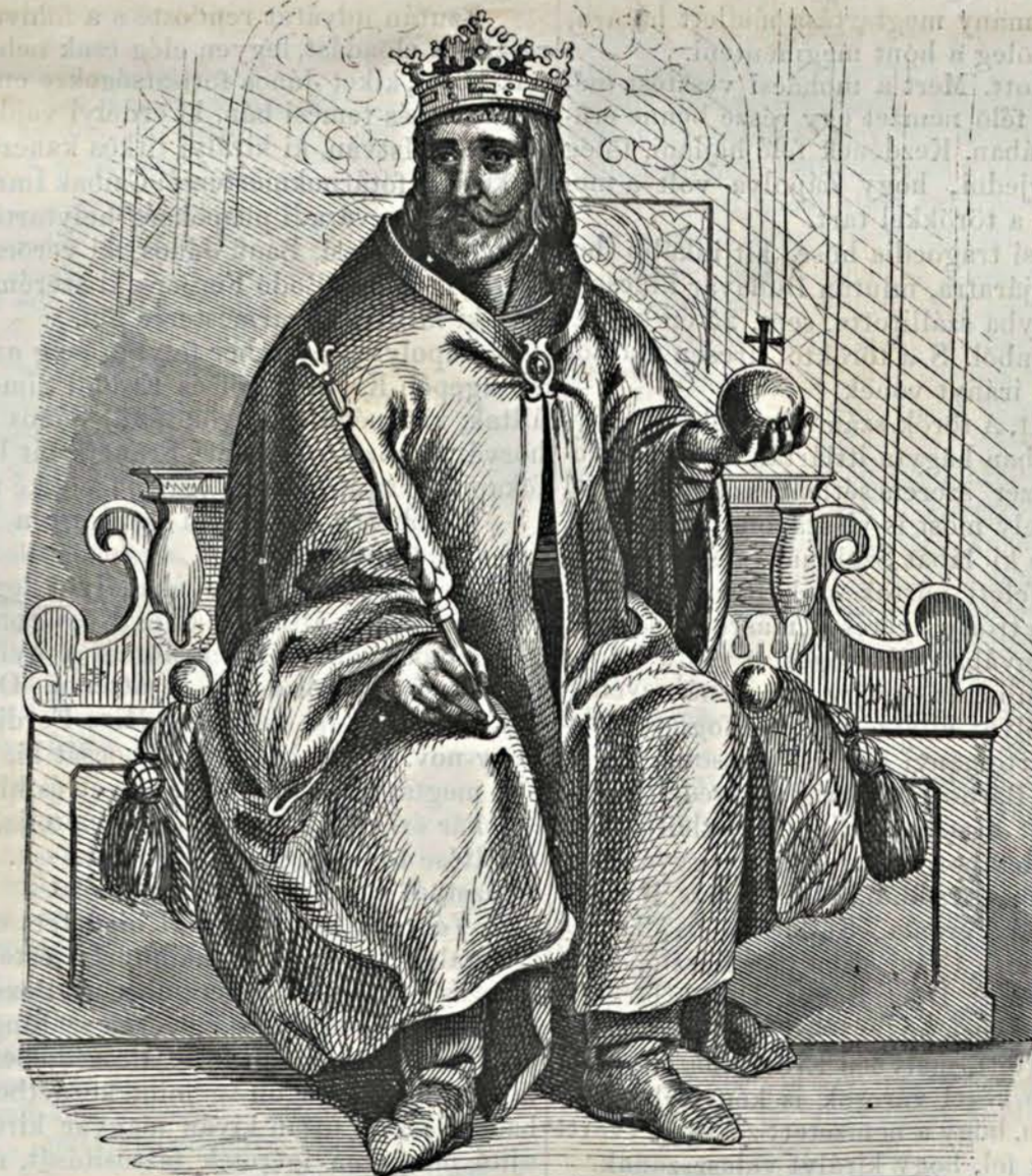
ZÁPOLYA JÁNOS KIRÁLY.