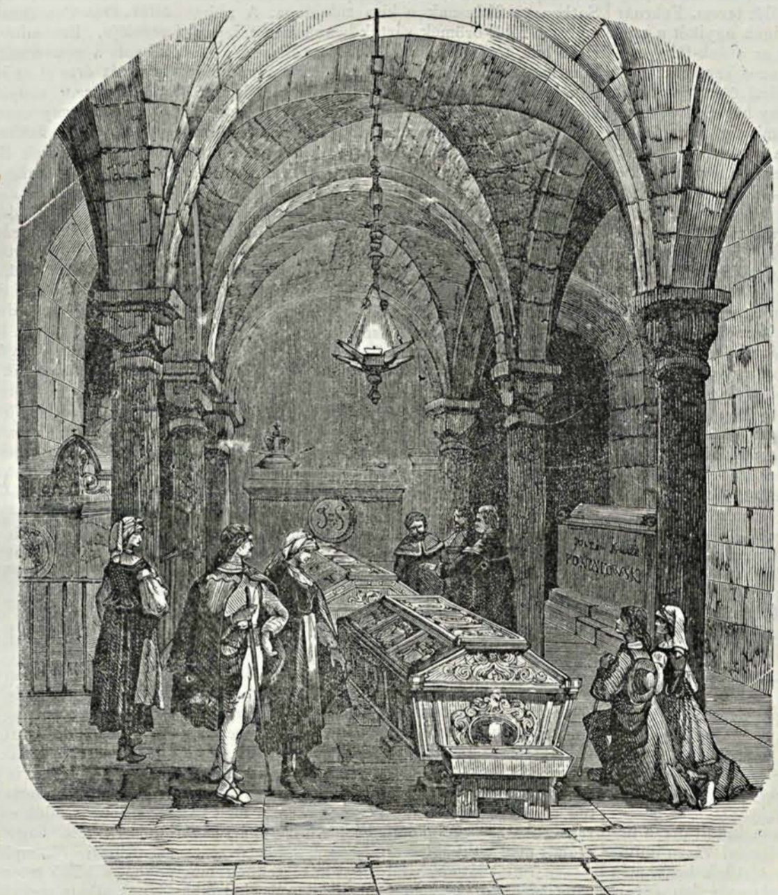
Sobieski sírja Krakóban.

Téli időben szomorú és pusztá a vidék. A fák a rideg levegőbe terjesztik fekete, mezelen ágait; a sövények lombtalanok, a mezők ki vannak