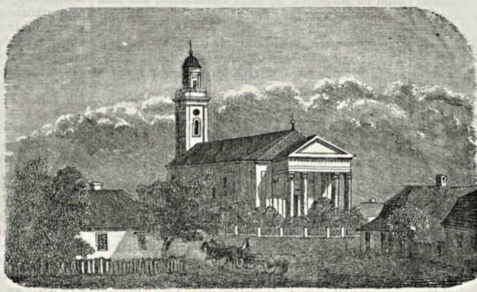
Mező-turi ref. templom.

Mező-Tur az alföld leggazdagabb városai közé tartozik, mit a gazdagok termő sok