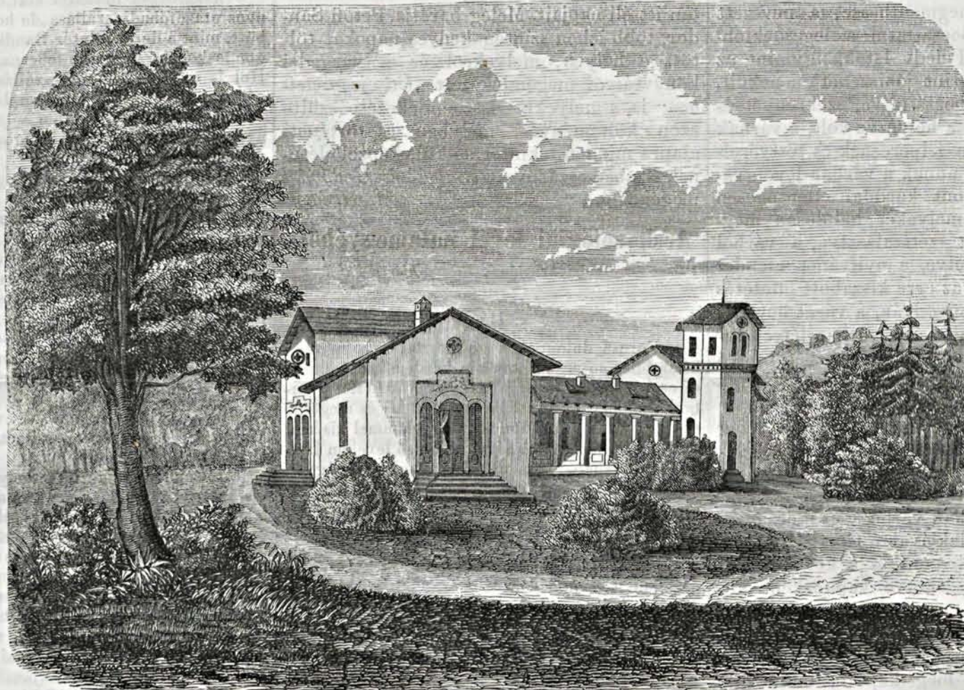
Mezei lak Várgedén (Gömörben).

Olaszországban jelenleg is ama szőlőtenyésztési rendszert találjuk. Az Alpoktól átlépve, még a venyige tenyészkaróhoz kötvé, a síkföld felé közeledve azonban, fanagyságra látjuk a szőlőt. A szántóföldeken a fák dúslobozatú venyigével vannak körülfontva, mely biborszínű fürtjeivel kellemes látványt nyújt. Egy ily tő különben annyi bort ad, mint 20 karószőlő. (Vége következik.)