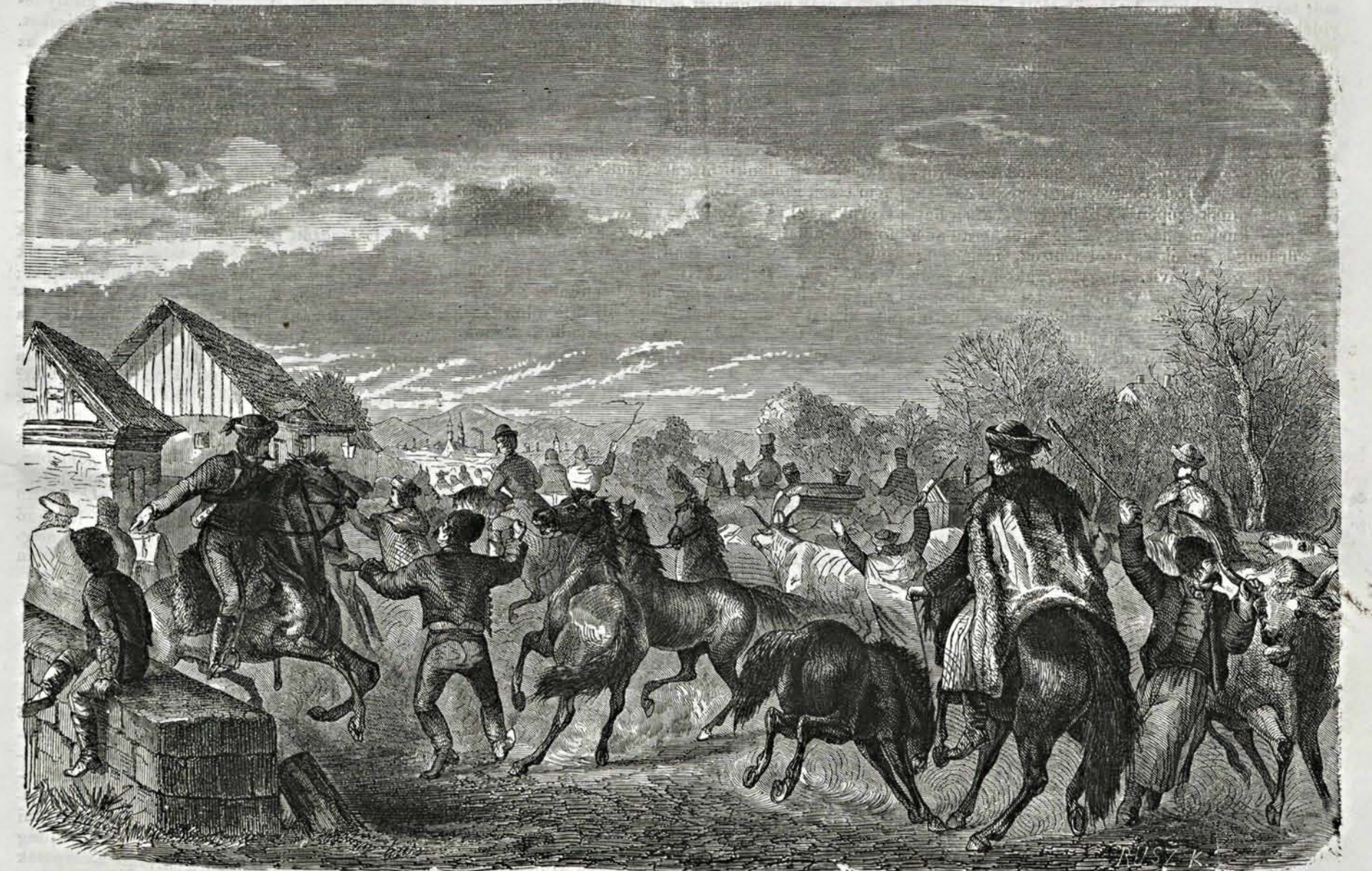
Pesti baromvásár. (Luders rajza után.)

A piac hátterében a mult században létesített püspökség palotája van. Rózsnyó területe az előtt az esztergomi érsekséghez tartozott. — A püspökség felállításakor pedig majd az egész urbarizáltatt. A 16-ik század elején „Szabad királyi Rozsnyó-Bánya városa“ nével élt e város, levéltára igazolványai szerint, mintegy századig; e minőségéből mikép esett ki, — homályban van. Mintegy félóránra a várostól, egy megszű-